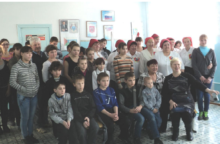
Мобильная бригада в Журавлевской школе