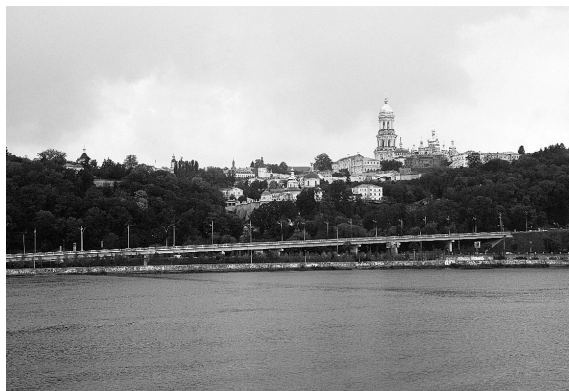
Киево-Печерская лавра, вид с Днепра