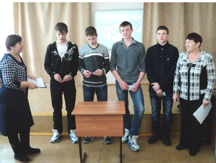
Вручение приписных удостоверений