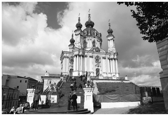
Андреевская церковь (Киев)