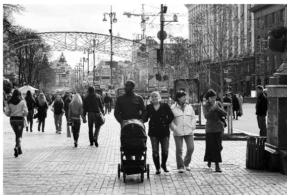
Исторический центр Киева - Крещатик