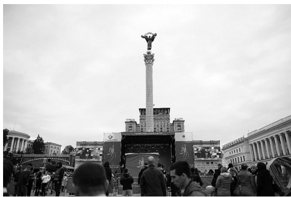
Майдан Незалежности - площадь Независимости