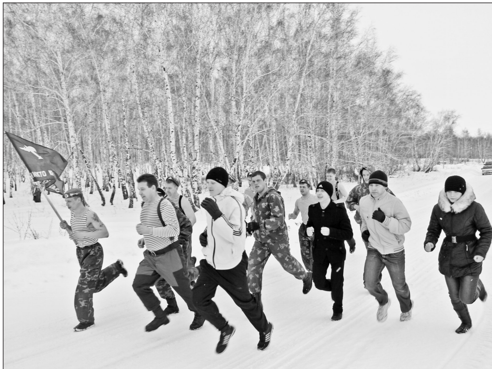
Главное — не обогнать товарищей. Главное — чувствовать себя одной командой

Их «компания», или, на официальном языке, Казанская районная общественная организация ветеранов боевых действий и во-