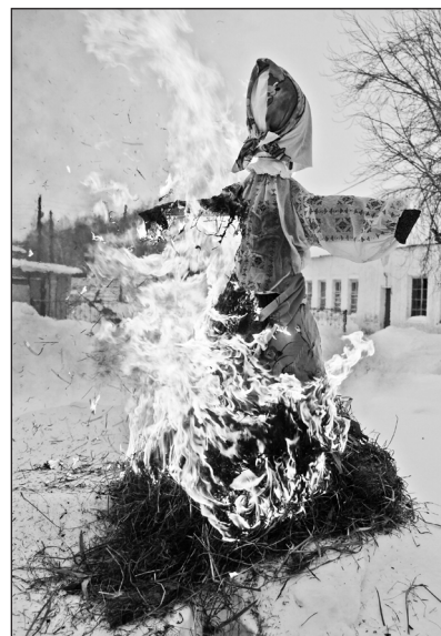
Сжигание чучела, олицетворяющего уходящую зиму, – традиционный обычай