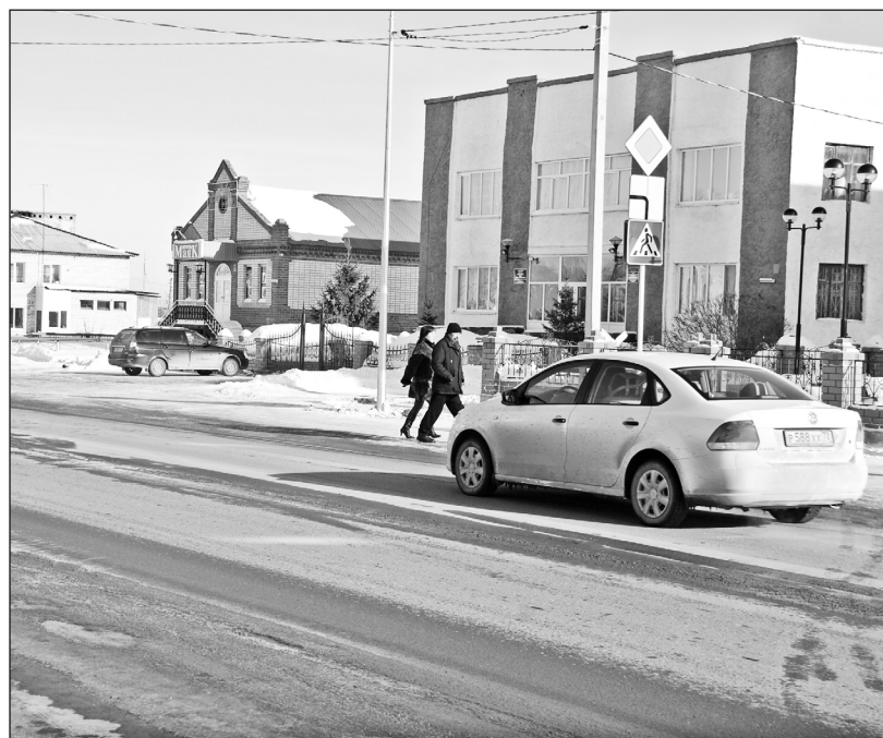
Пешеходный переход на центральной улице села Казанского

12.8 КоАП РФ 5 раз, В. по ч. 3 ст. 12.8 КоАП РФ — 3 раза, К. в 2013 году по ч. 3 ст. 12.8 КоАП РФ — 5 раз, в 2014 году — 1 раз, Я. в 2013 году по ч. 3 ст.