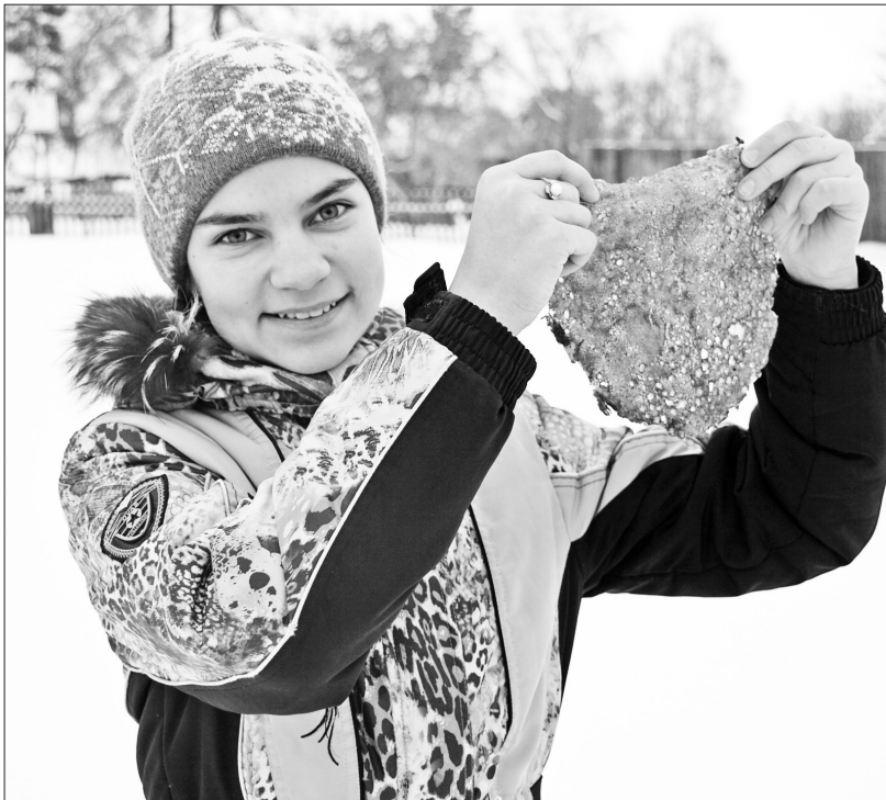
Любимое блюдо – ажурный, красивый блинчик

В этом году Масленица отмечалась с 24 февраля по 2 марта. И традиционно в школах района проводятся для детей мероприятия, посвящённые этому замечательному празднику – весёлому и вкусному.