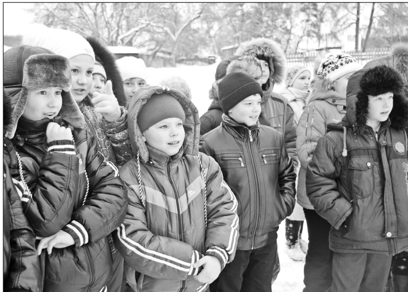
Школьникам на празднике было интересно