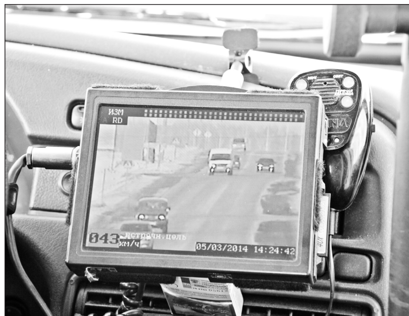
«Радис» даёт полный обзор на дороге

Нельзя не отметить, что для некоторых наших сограждан привлечение к административной ответственности стало делом системным. Чаще всего попадают в поле зрения ДПС люди, которые, употребив спиртное, садятся без зазрения совести за руль своего автомобиля или дают «погонять» своему нетрезвому товарищу. В 2013 году Л. привлекался мировым судьёй к административной ответственности по ч. 3 ст.