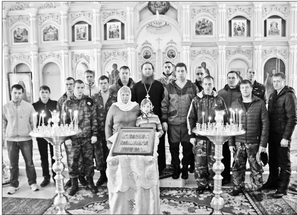
А в центре, как это и происходит в жизни, — крест и мама

«Первого марта в России отмечают День памяти воинов-десантников 6-й парашютно-десантной роты Псковской дивизии ВДВ. Девяносто десантников приняли неравный бой в Аргунском ущелье Чечни в ночь на 1-е марта 2000 года с более чем двухтысячной бандой боевиков. Восемьдесят четыре десантника пали в неравном бою, но не отступили ни на шаг. Эти молодые ребята не только выполнили свой воинский долг, они совершили бессмертный подвиг, он навсегда останется в наших сердцах. Сегодня мы чтим память земляков, погибших, защищая священные рубежи нашей Родины. Не вернулись из Афганистана Владимир Демьянцев и Николай Рябцев. Алексей Потапов, Олег Данилов, Сергей Поморцев, Сергей Шавков, Николай Сухарев и Александр Иванов погибли в Чечне. Вечная им память...»