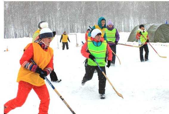
Женский хоккейный турнир