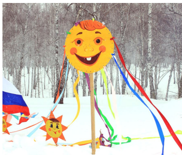
Забавное солнышко заставляло улыбнуться