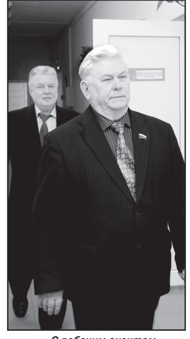
С рабочим визитом в Юргинском районе