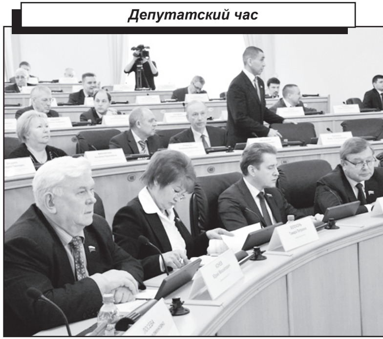
Двадцать третье заседание областной думы V созыва