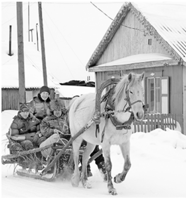
* Деревенская глубинка

Требуются разнорабочие мужчины до 35 лет без вред- ных привычек в Дубровное. Обр.: т. 8 9136078680.