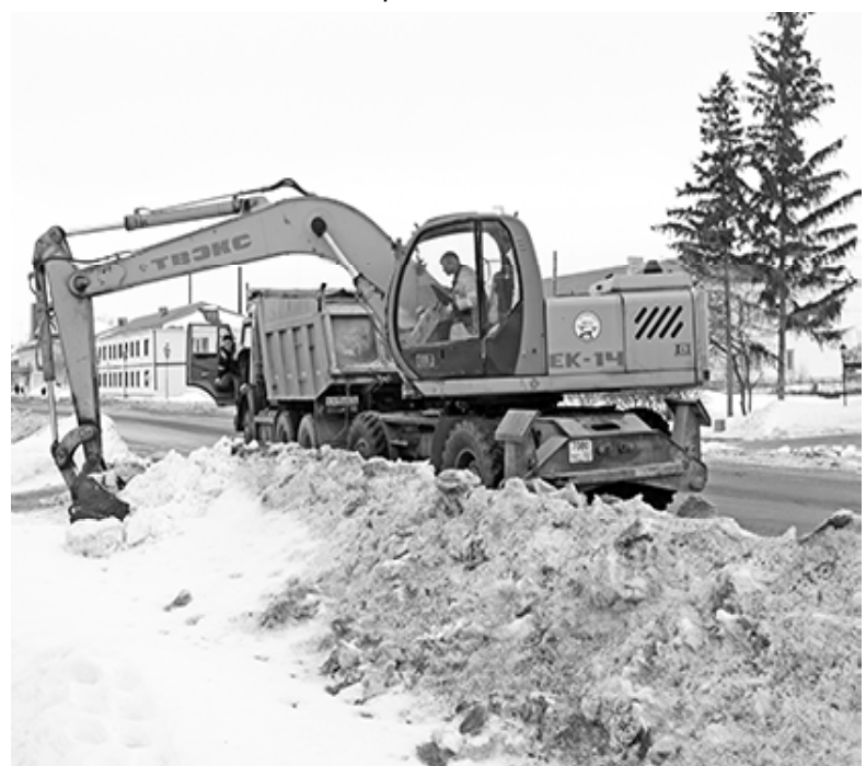
* На уборке снега