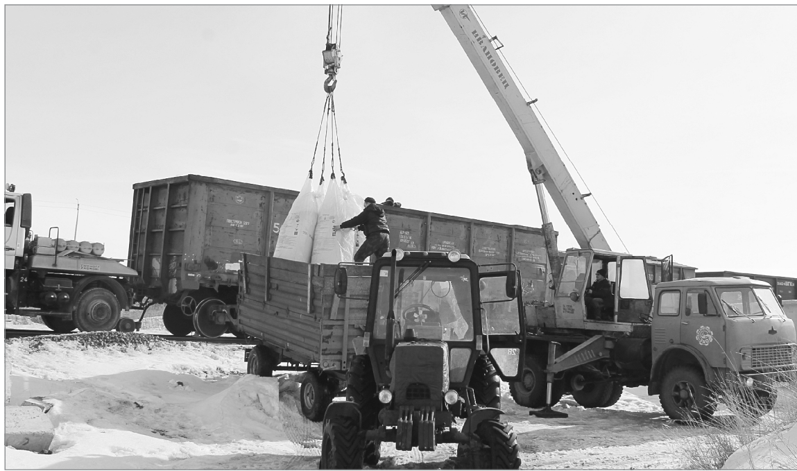
Прибыл последний вагон с минеральными удобрениями