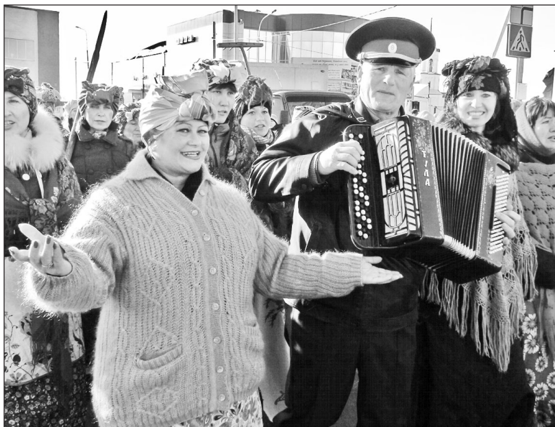
Народ веселился, провожая зиму

место занял СХПК «Колхоз им. Кирова», 3-е – ООО «Сельхозинтеграция». Поощрительную премию вручили СХПК им. Чапаева. Среди предприятий переработки лучшим признано ООО «Маяк-Продукт», на 2-м месте – ООО «Казанская рыба», на 3-м – агрофирма «Новоселёново». Поощрительную премию получило НП «С.О.К.О.Л.и Р.».