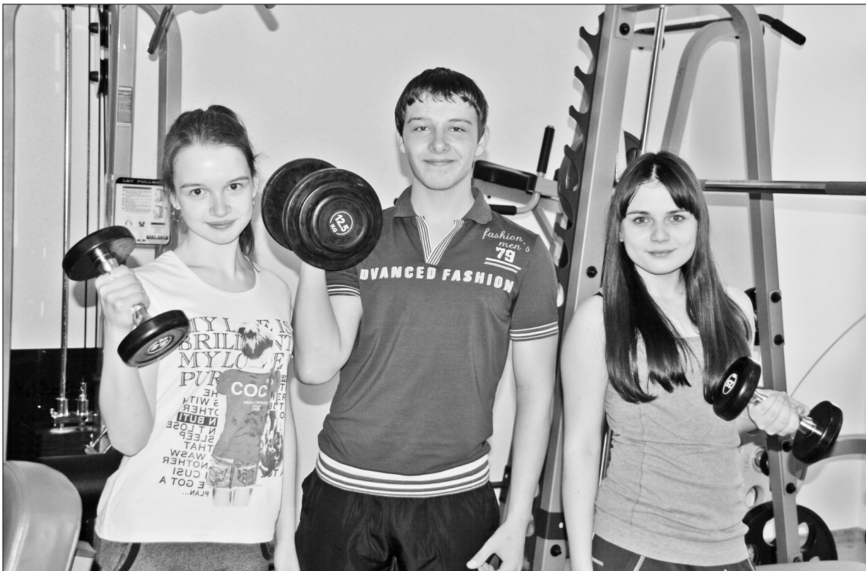
Наша молодёжь выбирает здоровый образ жизни