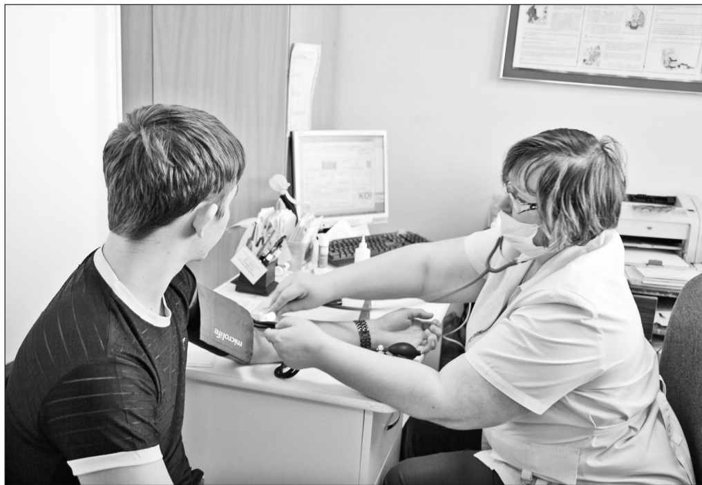
В кабинете доврачебного приёма

— В нашей больнице постоянно проводятся капитальные ремонты корпусов,