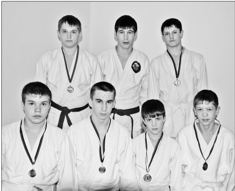
Эти ребята – спортсмены из ДСК «Медведь» – уже победители!