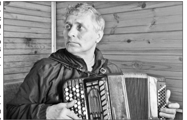
«О любви своей поют мне утром птицы...»