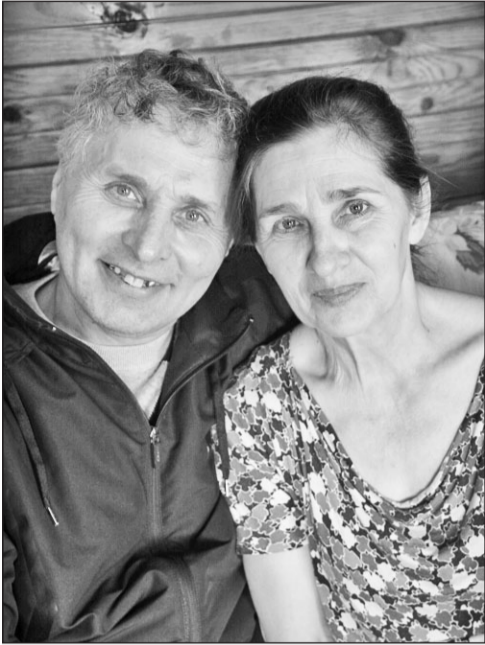
Супруги Саранчины – артисты, спортсмены и просто красавцы

(Окончание. Начало на 5 стр.) ТАРТАРИЯ ГДЕ-ТО РЯДОМ