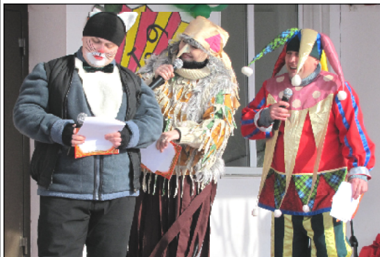
Театрализованное представление в исполнении работников культуры.