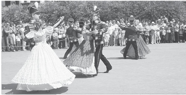
В вихре городского вальса

Автор стихов родился в Ялуторовске в 1952 году, и хотя сейчас