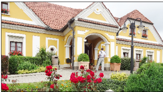
Архитектура кемпингов Австрии вызывает восхищение российских туристов.