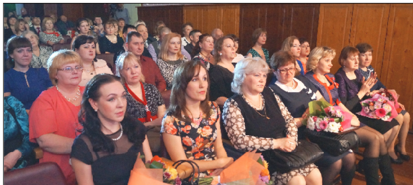
В сфере культуры района работают профессионалы, влюбленные в свое дело.