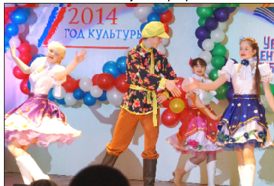
Захватывающий танец от выпускников Детской школы искусств.