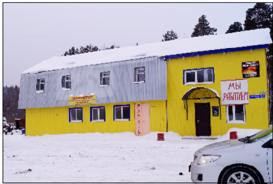
Включение комплекса «Людмила» в реестр проектов инвестиционного агентства позволит расширить бизнес.

Вдоль уватского участка федеральной автодороги, протяжённой 223 километра, расположено 40 объектов малого бизнеса. Фондом «Инвестиционное агентство» принято на сопровождение 3 проекта по организации придорожного сервиса в Уватском районе и предоставлена финансовая поддержка на 10 миллионов рублей.