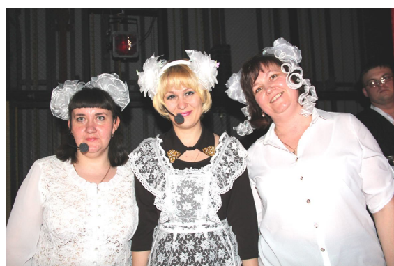
Из учителей МАОУ ОСОШ №1 - в школьниц

ОСОШ №2. Дружный учительский коллектив добросовестно потрудились. Проникновенно и выразительно