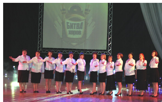
Сводный хор детских садов