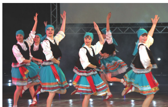
Танцевальная группа «Шарм»