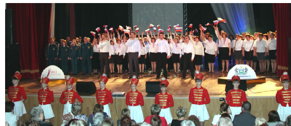
Открытие «Битвы хоров»