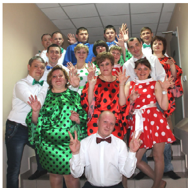
Хор МО МВД России «Омутинский»