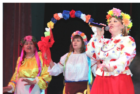
Поют украинскую песню