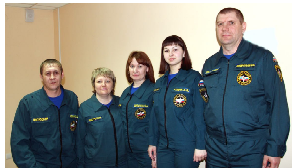
Часть хора МЧС