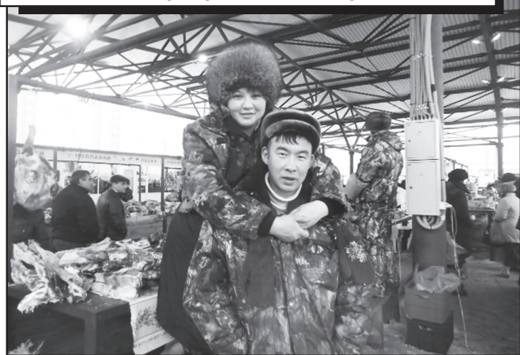
На ярмарке сельхозпроизводителей в Тюмени