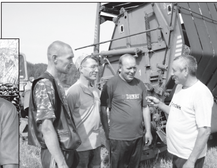
На заготовке кормов

Северо-плетнёвская земля была свидетельницей противоречивых исторических событий, о которых