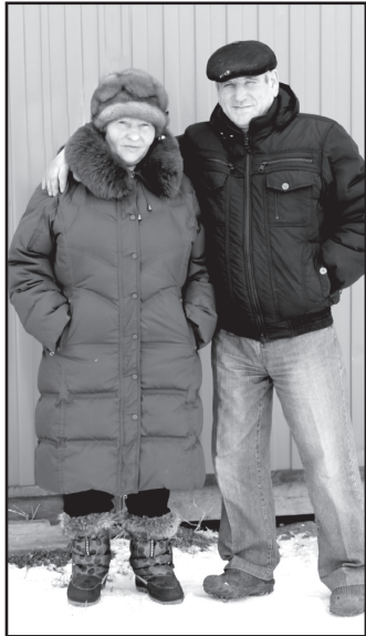
С супругой Анной Григорьевной