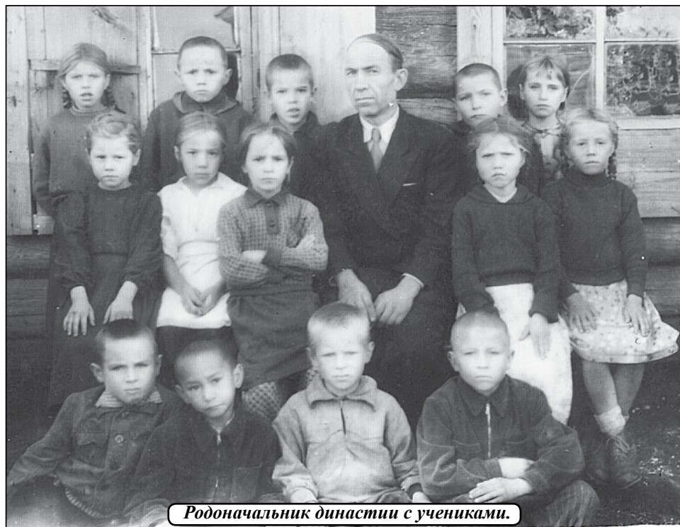
Родоначальник династии с учениками.

Материалы с ФИО автора, местом проживания и контактным телефоном принимаются по адресу: с. Упорово, ул. Володарского, 31, а также по электронной почте: znamjapravdy@mail.ru.