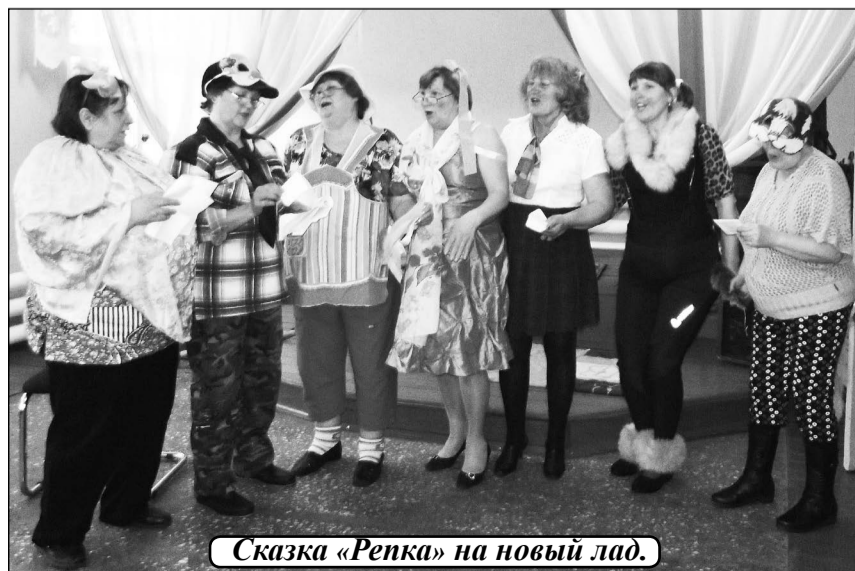
Сказка «Репка» на новый лад.