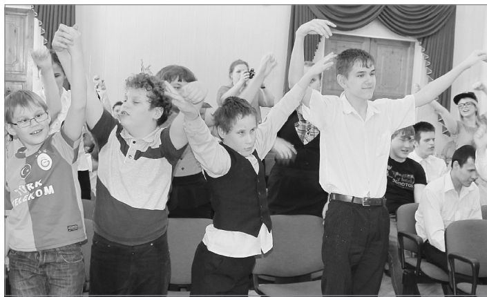
Возьмёмся за руки, друзья!

ям. После переезда в областную столицу решили систематизировать свою деятельность. Создали фонд, основным направлением которого стала помощь ребятишкам с тяжёлыми заболеваниями.