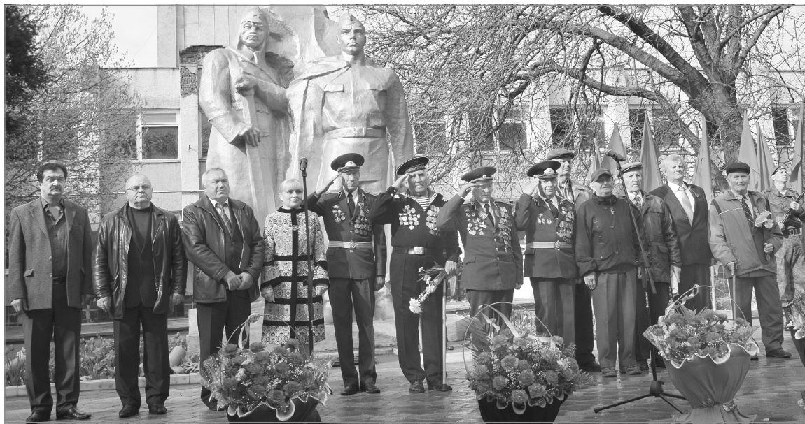
На торжественном митинге в поселке Черноморское