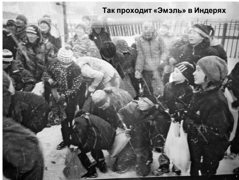
Так проходит «Эмэль» в Индерях