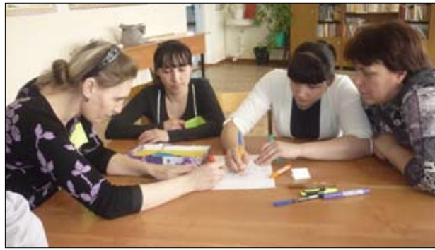
Родители снова сели за парты

Каждому классу предстояло прожить полноценный день ученика: уроки, перемены и даже настоящий обед в столовой. Чему только не учились в этот день новоиспечённые школьники! Путешествовали в страну Лингвистику, производили анализ клетки растения, вспоминали правила дорожного движения, инсценировали басни и сказки, изготавливали тютюльпаны из фантиков и мудрых сов из пластили-