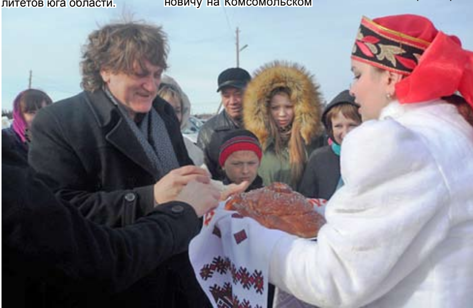
В Верхних Аремзянах участников экспедиции встречали хлебом-солью

Т. ГОЛЯШКОВА, директор Центра детского творчества