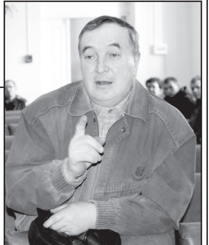
Диалог «люди – власть»