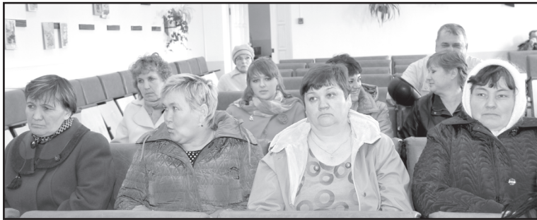
Сход – это возможность услышать ответы на свои вопросы, обозначить проблемы, которые волнуют

Что для представителей районной власти данные выезды? Это возможность на местах оценить ситуацию на каждой территории: узнать о том, чем живёт поселение, какие события