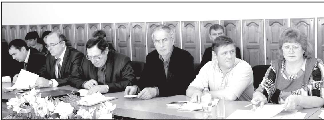
Участники агрономической конференции

– Наш отдел занимается оказанием услуг предприятиям сельскохозяйственного назначения, связанным прямо с зернопроизводством. В том числе определением качества семян. За минувшие осень и зиму специалисты проверили состояние качества 5830 тонн зерна, предназначенного для закладки основы будущего урожая. Готовность материала