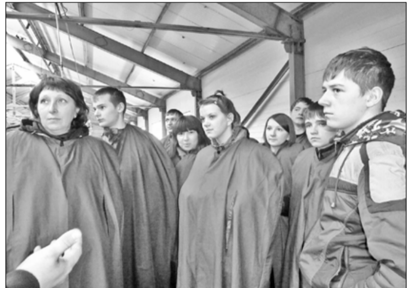
Экскурсия была интересной и познавательной

Компьютерная система обладает всей информацией о работе и обитателях фермы. Компьютер может дать сведения о расположении на ферме на данный момент и физиологическом состоянии каждой особи (возможно, какая-то из них готова к осеменению или, не дай бог, заболела), а также показать количество молока, поступившего в танк (специальную накопительную ёмкость), сколько молока дала каждая корова (за раз и за весь день) и даже каждая доля