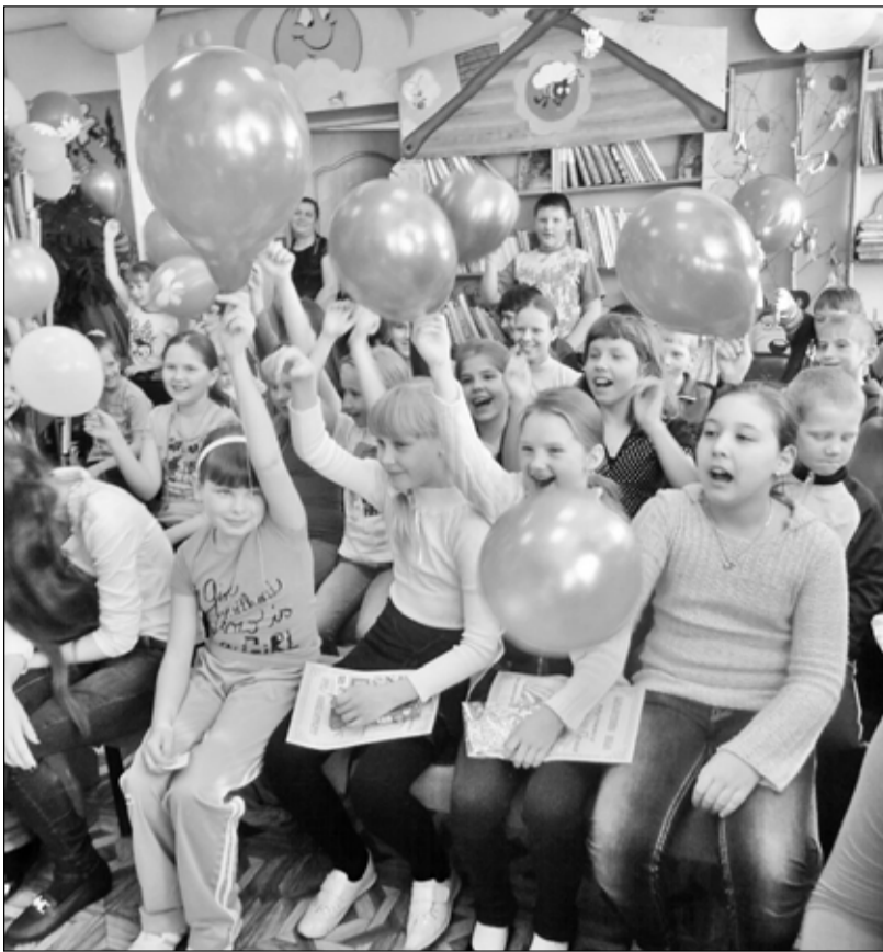
Дети – самые активные и благодарные посетители библиотеки

Во второй день недели ребята вместе с отважной пираткой Велл отправились в увлекательное путешествие по морю Чудес через остров Загадок к материк Забытых вещей. В пути ребята, собирая артефакты, узнали не только много интересного об истории привычных вещей, но и смогли найти сундук с сокровищами. В середине недели ребята посетили видео-лекторий «Книга на экране». В рамках мероприятия транслировались отрывки фильмов по произведениям писателей-юбиляров. Итогом этого дня стала викторина, на вопросы которой дети отвечали с большим