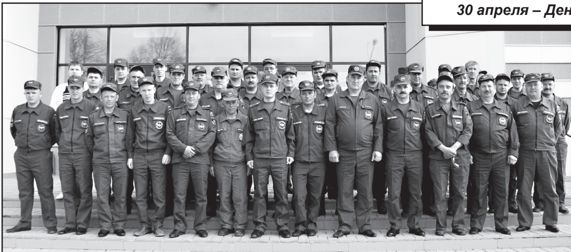
Коллектив 147 ПЧ «26 ОФПС по Тюменской области»

появились в Москве и Петербурге в 1804 году. Комплектовались они из отставных солдат, не способных воевать на фронте. Однако примитивная техника, отсутствие эффективных средств тушения не позволяли в ряде случаев успешно бороться с огнём.