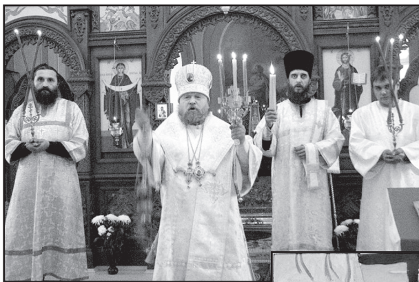
Епископ Тихон в с. Юргинское

Признаюсь, я всегда считала, что слово «пасха» – от древнегреческого «страдать». Оказывается, от древнееврейского «пэсах», что буквально означает «прохождение мимо». В Ветхом завете на этот счёт своя история. Христиане видят в Пасхе два мотива: освобождение от рабства и пришествие миссии – смерть и Воскрешение Иисуса Христа. Об этом рассказал прихожанам во время службы в Светлый четверг епископ Ишимский и Аромашевский Тихон. А ещё поведал, что Пасха во всех храмах епархии прошла ярко и массово. В Армизоне собрались на Праздник праздников учащиеся всего района, в Ишиме состоялся пасхальный концерт во Дворце культуры: лучшие творческие коллективы, воспитанники воскресной школы Никольского кафедрального собора участвовали в нём. В Казанском, Аромашевском, Бердюжском районах прошли праздничные мероприятия (прошу прощения