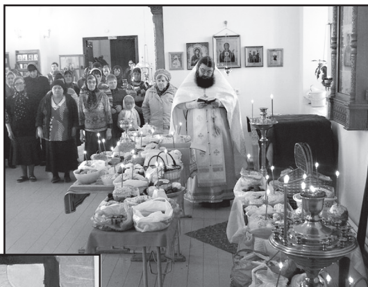
Великая Суббота, освящение пасхальной снеди