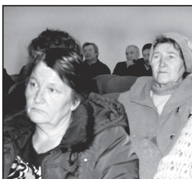
Жители Володинского сельского поселения

В деревне Маркеловой и селе Володино убрали старые деревья, представлявшие большую опасность для людей и строений. Молодые деревья и кустарники подстригли, подбелили. По улице Советской, где был пустырь, заложили новый парк. Нынче продолжим в нём работы. Между детским садом и рынком посадим юбилейную аллею рябины к 70-летию Тюменской области. Наместили разбивку клумб и цветников, субботники на территориях ДК, образовательного, дошкольного, других учреждений. Не оставляем без внимания места отдыха володинцев, расположенные на берегах рек и местных рукотворных водоёмов. Углубляем и чистим их русла, берега, подходы, запускаем в них мальков рыб. Прилагаем все усилия, чтобы были привлекательными места отдыха.