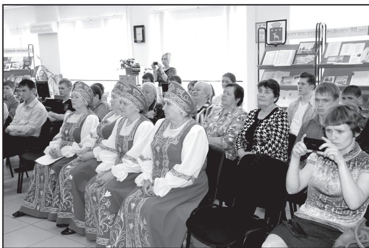
В зрительном зале

На Юргинской земле есть немало красивее мест, Многолюднее сёл и полей плодородней, но всё же Нет любимей тебя, живописней окрестностей нет,