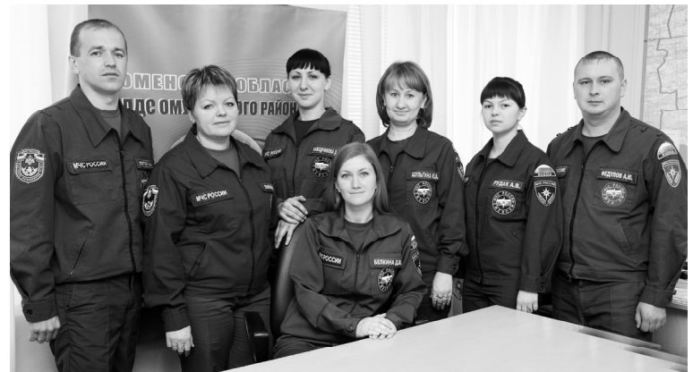
Сотрудники ЕДДС Омутинского района

Для разрешения нештатных ситуаций, угрожающих жизни и здоровью людей, во всех странах мира существуют службы экстренного реагирования. В России такая служба получила название Единой дежурной диспетчерской службы (ЕДДС). Она не подменяет собой полицию, скорую медицинскую помощь и противопожарную службу. ЕДДС координирует действия этих структур, снабжая их необходимой оперативной, достоверной информацией.