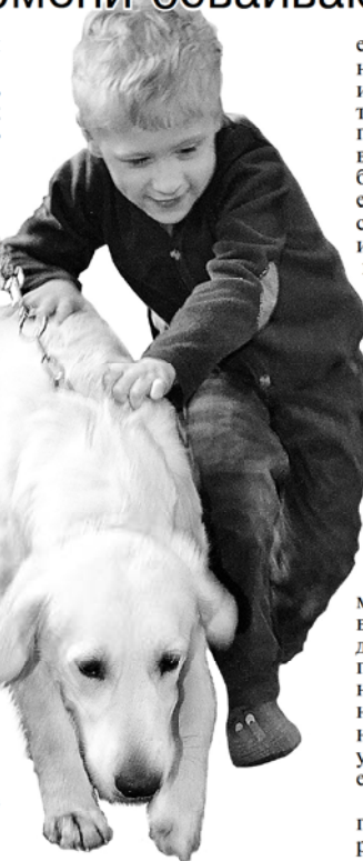
Желающих попробовать новый метод уже достаточно.

по стране зачастую работают каким-то кустарным методом, когда кинологи либо просто владельцы собак ходят и занимаются к больному ребенку, не имея представлений, как это делается, а собаки не имеют навыков, — рассказывает Ермакова. — Получается просто общение ребенка с собакой. Оно в любом случае сказывается только позитивно на эмоциональном состоянии малыша, но называть это терапией нельзя».