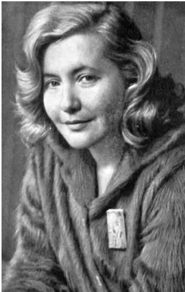
• Юлия Друнина: «Я ушла из детства в грязную теплушку...»

В ликующем 1945-м старшине медицинской службы, а позже – фронтовой поэтессе Юлии Друниной исполнился всего 21 год. Но какую школу жизни прошла эта хрупкая девушка за годы войны!