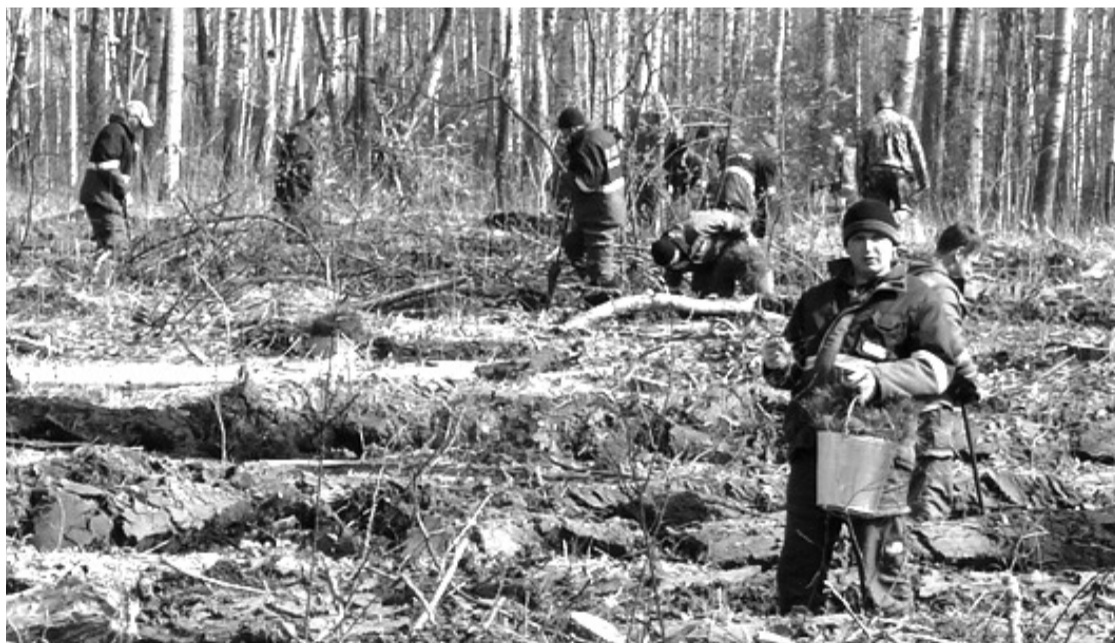
• В этом году в границах нашего округа намечено провести лесовосстановление на 283 гектарах: Заводоуковский филиал авиабазы посадит 130, «Сибжилстрой» – 60, «Переработка» – 20 и «Загрос» – 73 гектара будущего леса.