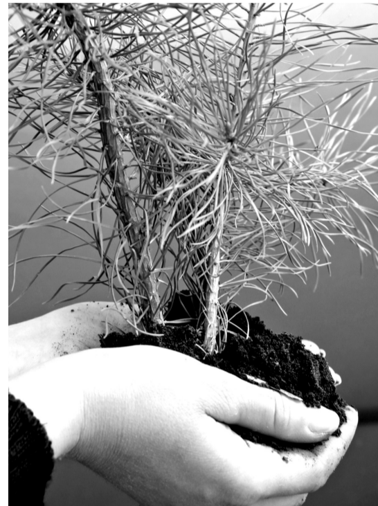
• Сто лет должно пройти, чтобы из сеянца сосны выросло дерево.