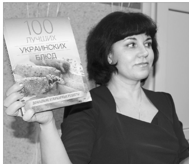
А вот ещё приз!

Подвели и итоги акции «Напиши от души». Несколько недель люди писали своему любимому учреждению письма-записки, в которых выражали благодарность сотрудникам за встречу с хорошими книгами, пожелали приумножать число читателей.