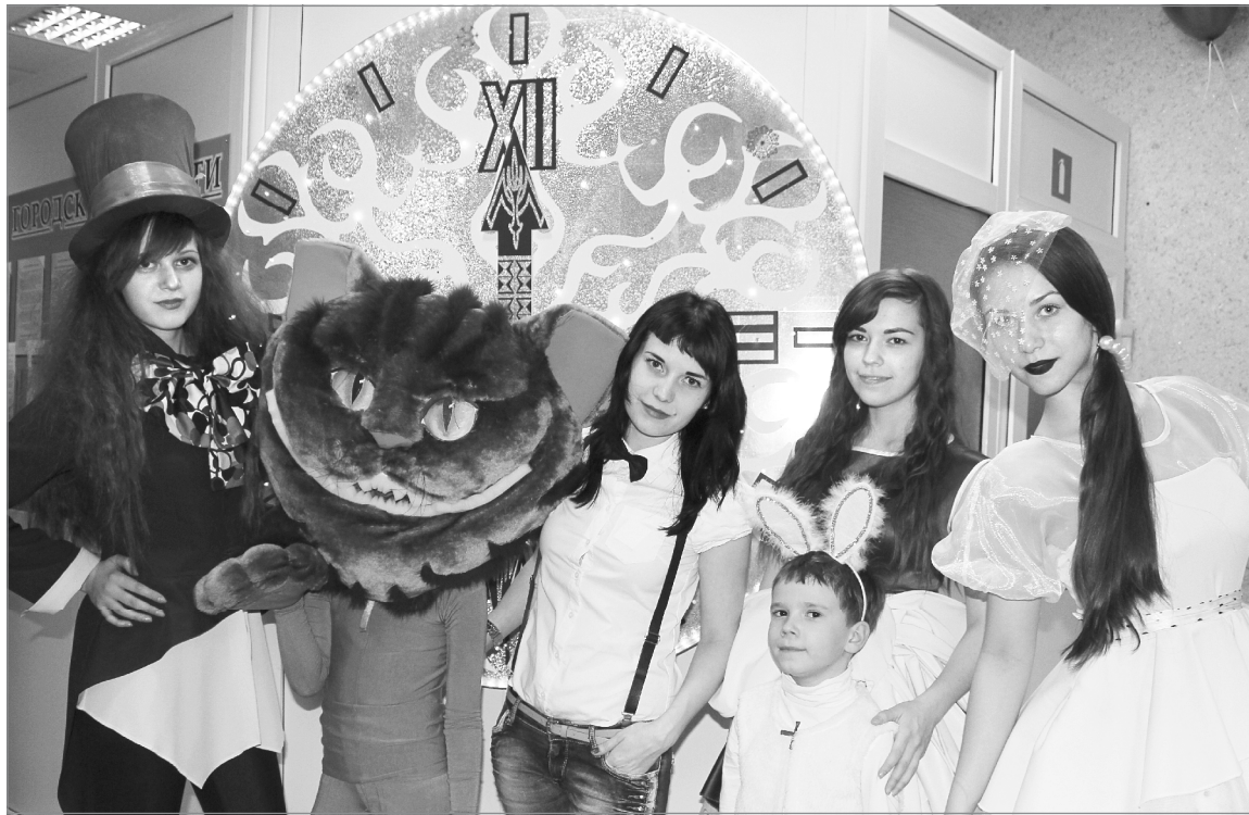
«Приглашаем в мир сказки!»

Самых юных читателей развлекали Кот Базилио и Лиса Алиса, Баба-Яга, Микки Маус и другие сказочные персонажи. Ребята окунулись в мир любимых литературных героев и веселых конкурсов. Для начала они сложили огромный пазл. Получившаяся картинка оказалась афишей «Библионочи». С интересом детвора занималась в мастер-классах по различным видам прикладного творчества. Особенно понравилось всем де-