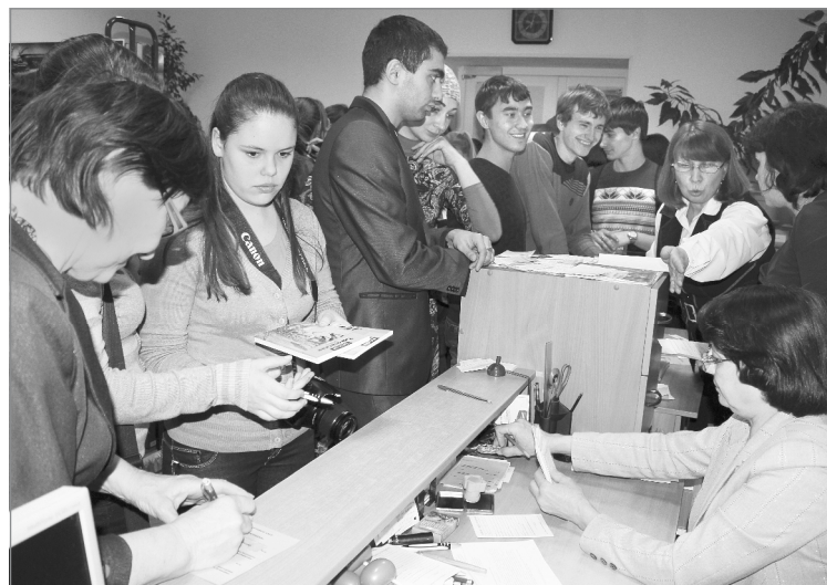
Читателей в библиотеке прибавилось