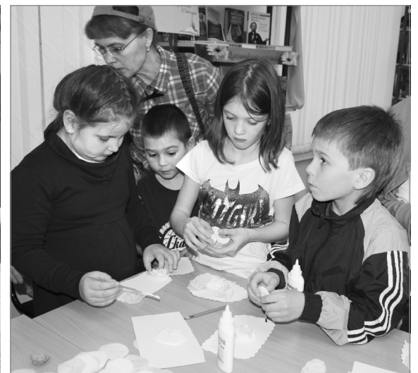
Что из этого получится?