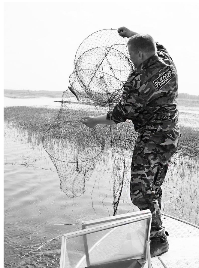
Вот они – браконьерские снасти.

Все понимают, что обнаруженные в ходе рейда снасти незаконного лова рыбы – это только капля в море тех ловушек на рыбу, которыми заставлены все наши водоёмы. Мало того,