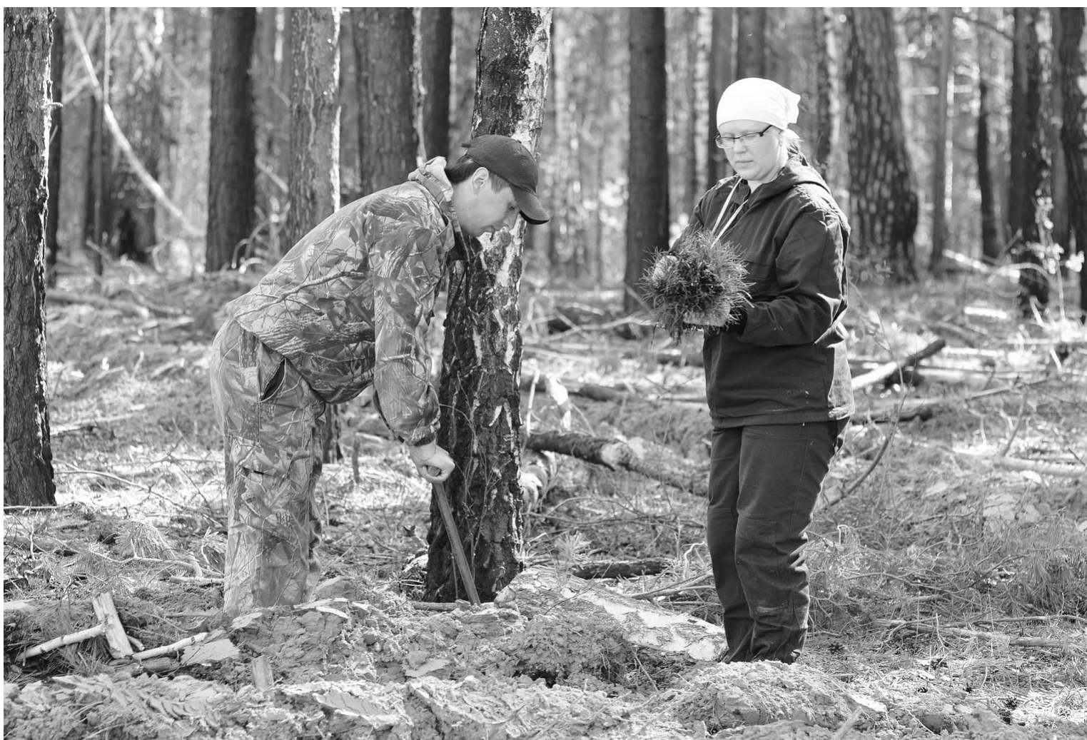
Пусть из каждого саженца вырастет красивое, сильное дерево.

Именно столько саженцев в пятницу, 16 мая, высадили на заранее подготовленном для посадки гектаре угодий работники отдела и Нижнетавдинского лесничества в рамках национального Дня посадки леса. Это наше российское изобретение, а был он инициирован Федеральными властями в 2001 году как мера восстановления лесов, пострадавших от пожаров. Идея праздника по нравилась экологами, работникам лесной отрасли, студентам и школьникам, её поддержали муниципальные и сельские власти – вот так и стал этот день традиционным.