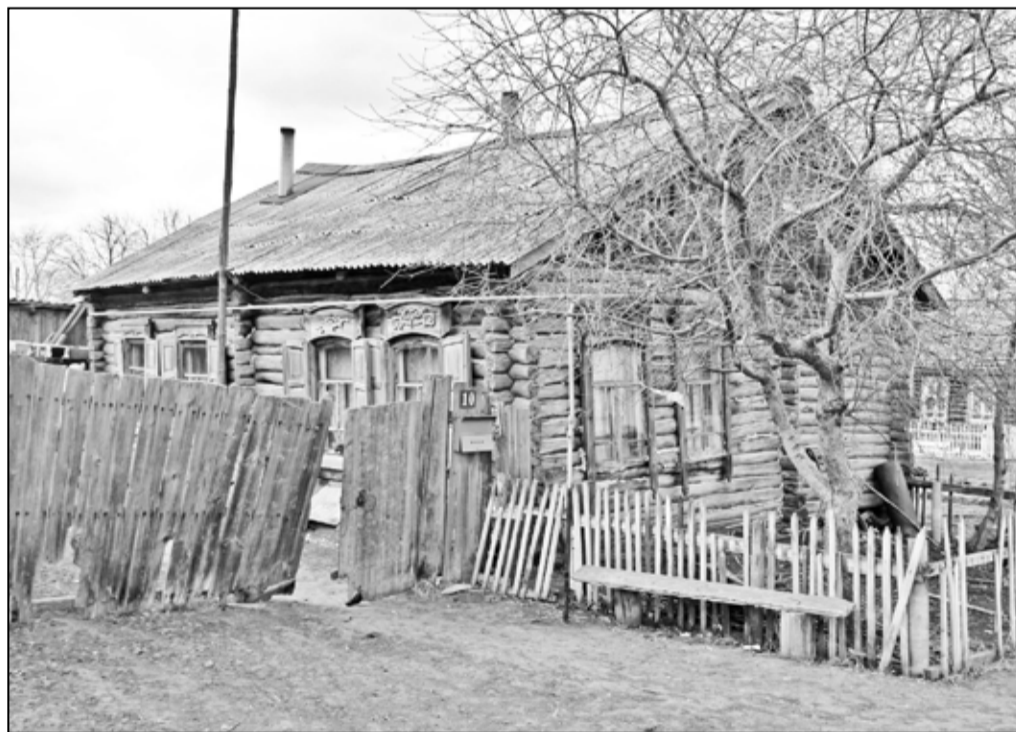
Печально, но факт – в этом строении живёт многодетная семья

цам свиноматок по факту опороса организована доставка комбикорма. В каждом населённом пункте имеется возможность через коммерческо-сбытовой кооператив реализовать молоко. Закупочная цена первого сорта молока составляет 13 рублей за один литр плюс дотация 4 рубля за литр.