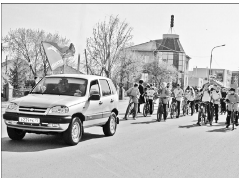
Начало велопробега в с.Казанском

Так же торжественно колонна велосипедистов двинулась в обратном направлении – от Новоселзёво до Казанского. Прохожие встречали ребят радостными улыб-