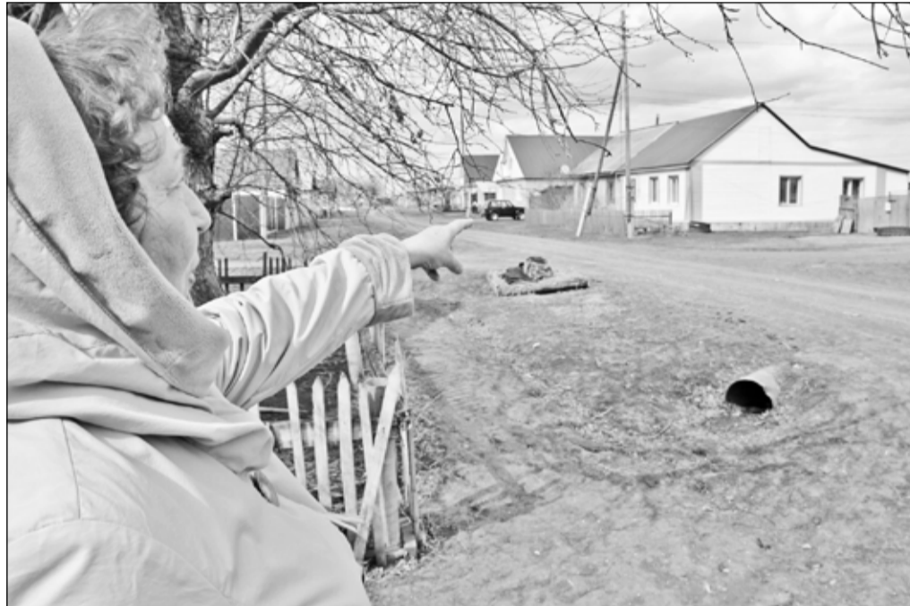
Улица Береговая. В той половине дома, что смотрит на нас с вами, живёт семья из двух взрослых и одиннадцати детей