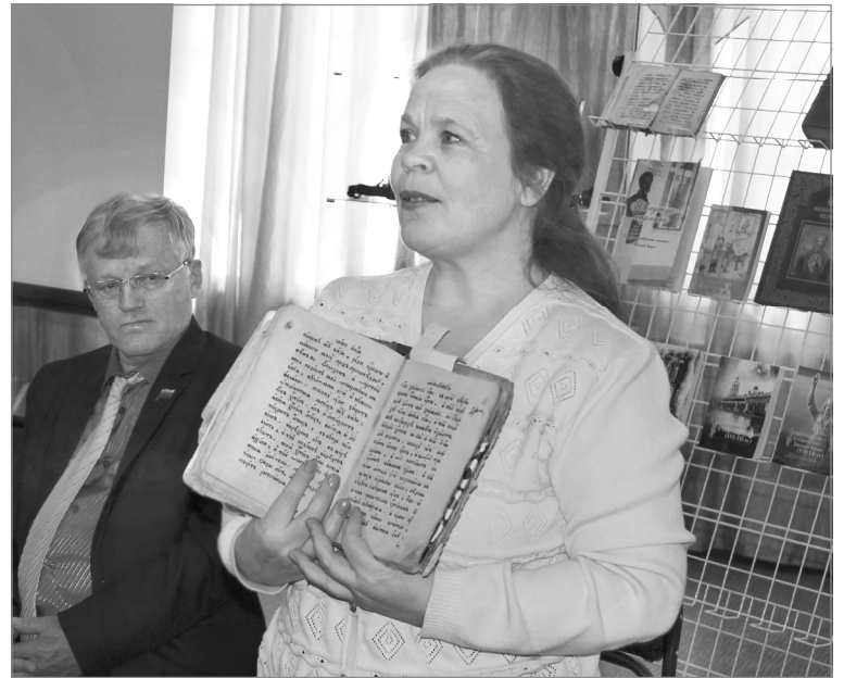
Вот русское-то слово...

Занимаясь изучением вопроса о заселении территории, лежащей за Уральским камнем, о тех, кто жил и сейчас живет в Сибири, она находит неразрывную связь человека с верой. Поэтому главная тема в исследовани-