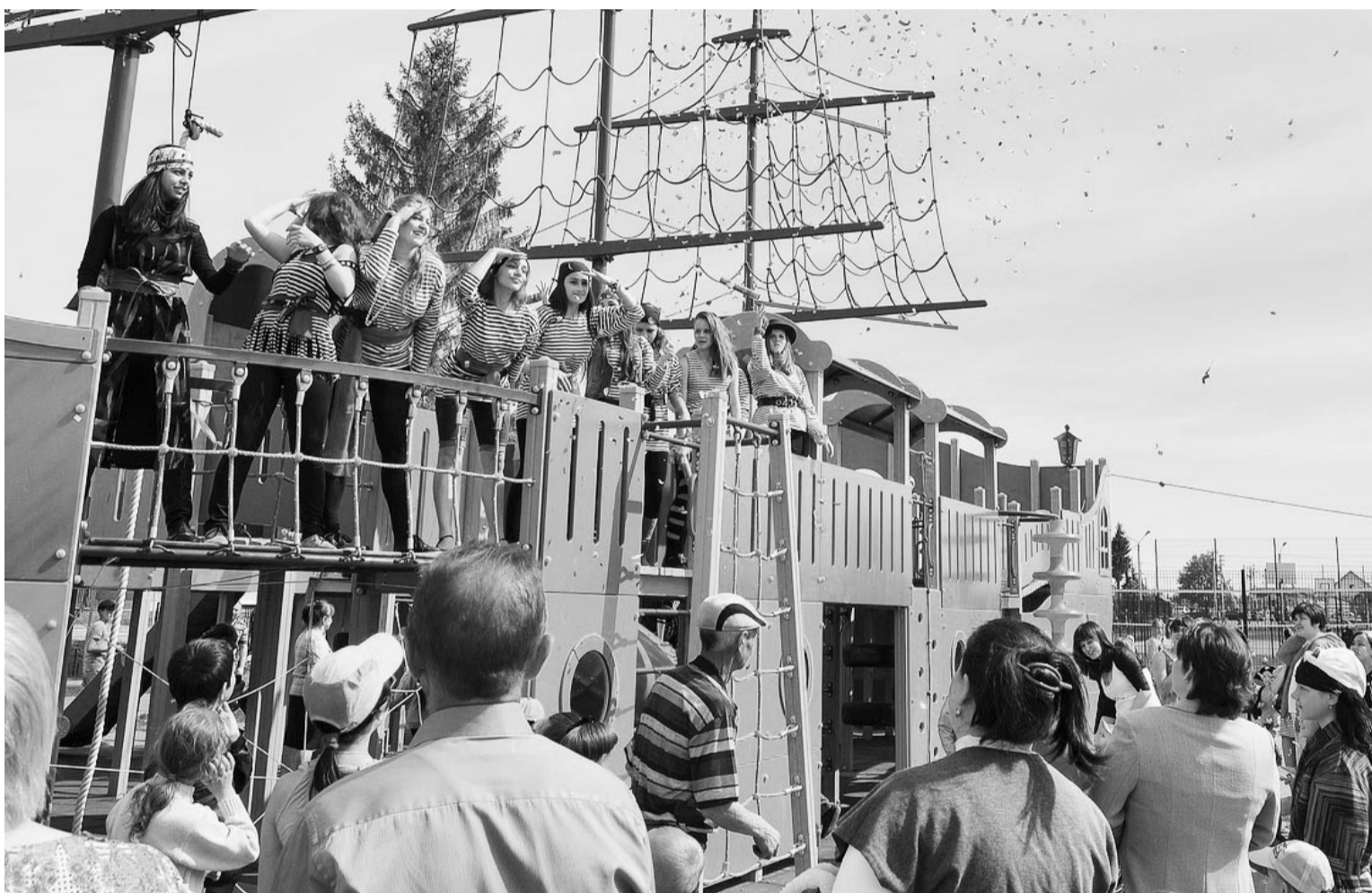
Не хотите ли отправиться в мир приключений с весёлыми пиратами?!

Эти слова стали девизом яркого незабываемого праздника – Дня защиты детей, который проходил 1 июня в спортсквере им. Федосеева П. И., куда «причалил» настоящий пиратский корабль «Чёрная жемчужина».