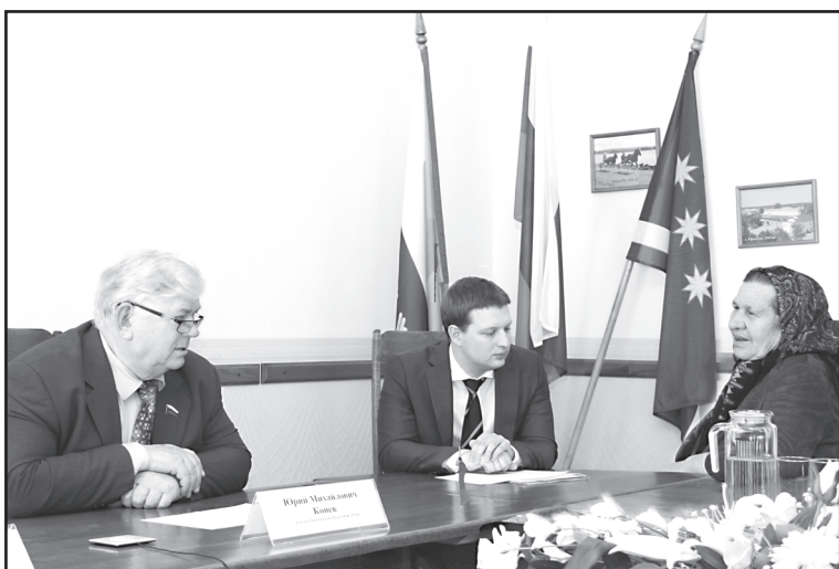
В депутатской приёмной

Депутатскую приёмную громким мероприятием не назовёшь. Здесь звучат вопросы, на первый взгляд, тривиальные: дрова, старые дома и печи, ремонт крыш. Здесь не говорится о том, о чём принято говорить на широкой аудитории. Просьбы и обращения, нередко – слёзы. Депутатской помощи и необходимых рекомендаций ждут больше всего. Результат – решение множества частных проблем. «Вся эта боль и беда – в нашей семье», – сказала мама мальчика, страдающего онкологическим заболеванием. Так важно помочь ребёнку, поддержать родителей. «Дрова дорогие, а пенсия небольшая». Подсобить пожилым, которым помочь с за-