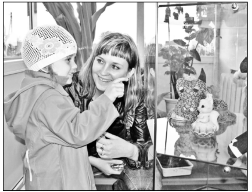
Не знаете чем удивить детей? Приведите их в музей

Один из залов музея представлял собой советскую квартиру, и здесь были собраны предметы быта советских времён. Вот кровать, застеленная белым кружевным покрывалом. На кровати спит, свернувшись калачиком, пушистый кот (кот этот – игрушка, а так хотелось его погладить, потому что создавалось ощущение, что он живой). Над кроватью на стене висит самодельный ковёр необыкновенной красоты, рядом с кроватью стоит кованный сундук, покрытый сверху мягкой тканью. Во времена военные и довоенные он выполнял роль спального места. И сидеть на нём было всегда удобно. Синий посудный шкаф-буфет очень украсил этот музейный зал. А в нём – посуда со-