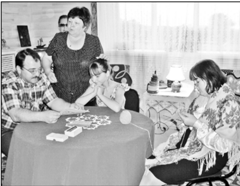
Семейный вечер советской поры

А больше всего понравилось гостям «Советское кафе». В продаже – напитки: чай, квас, морс, простое (но очень вкусное) печенье, леденцы и многое другое. Продавщицы – в нарядных белых фарточках, с кокетливыми кружевными повязками на волосах, как носили раньше, в советские времена. И деньгами расплачивались покупатели советскими – бумажными и монетками. В общем, всё получилось очень здорово.