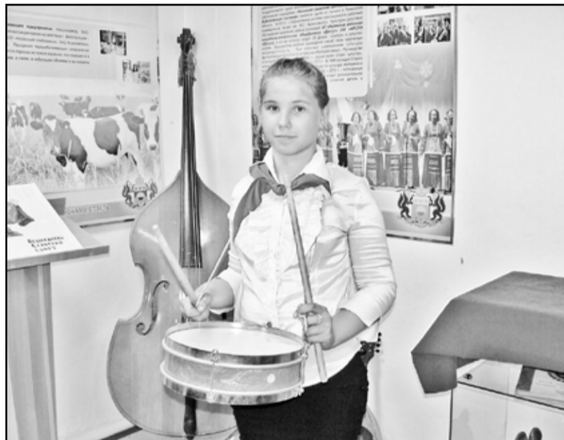
Вспомнили детство пионерское