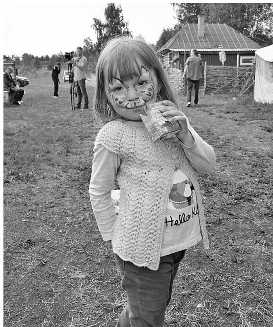
С яркой раскраской на лице праздник был ещё более радостным.