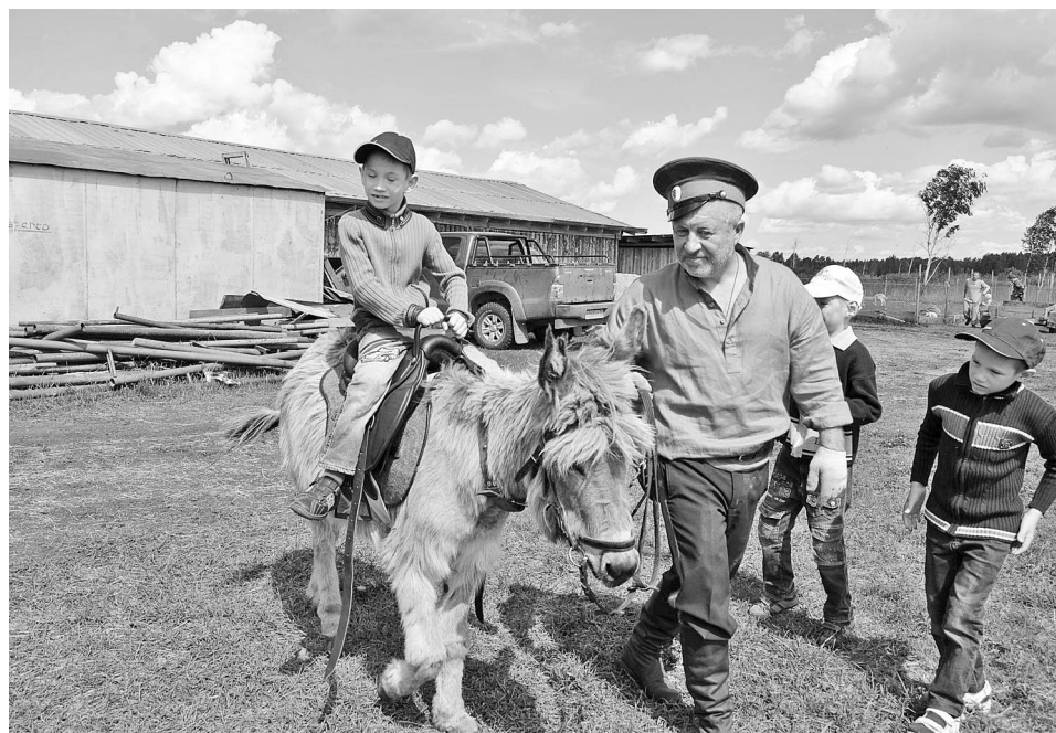
Самые маленькие прокатились на ослике. Животное не было против такого «общения».

щения! После экскурсии по подворью воспитанников Борковского и Зырянского детских домов ждал праздничный стол со сладостями, фруктами и вкусными напитками. Яркая раскраска на лицах, весёлые клоуны, катание на лошади и ослике,