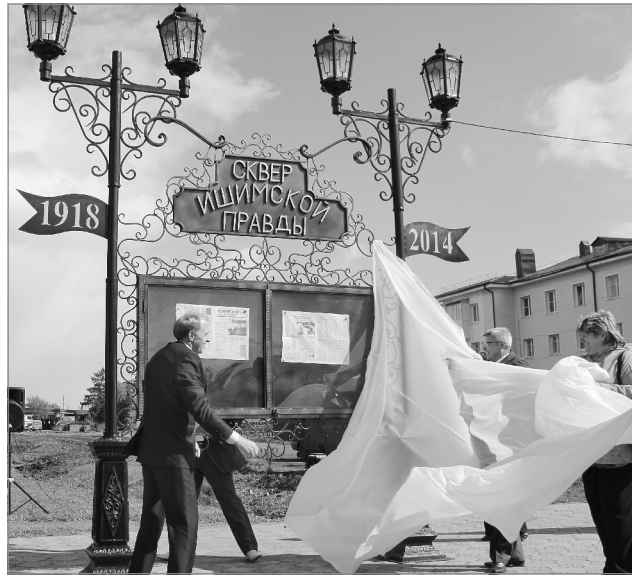
Да будет сквер!