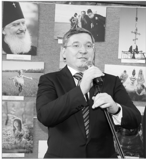
Владимир Якушев: в области много счастливых людей