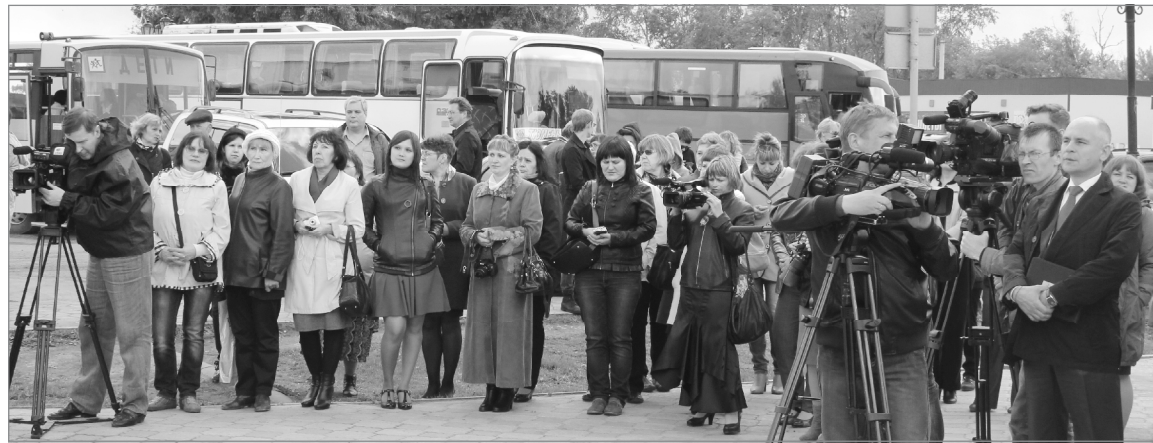
Журналистам интересно всё

Сам фестиваль и его награды стали стимулом журналистам всех средств массовой информации для дальнейшего творчества. И для нас - в том числе.