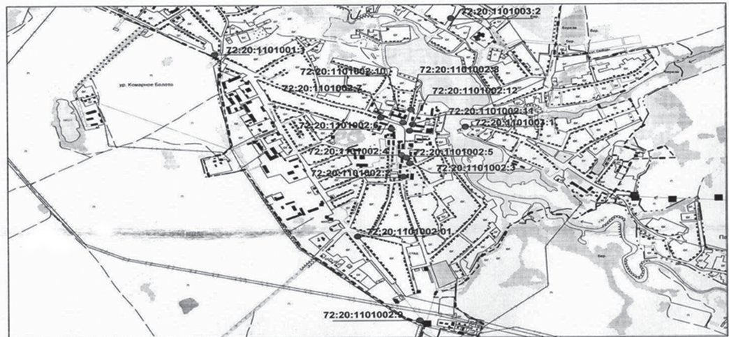
СХЕМА размещения рекламных конструкций в с. Юргинское Юргинского района Тюменской области М 1 : 25000