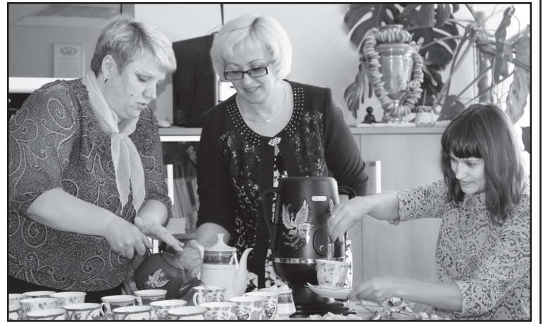
День открытых дверей в КЦСОН

А затем для всех желающих была проведена экскурсия по зданию. Кабинет социально-бы-