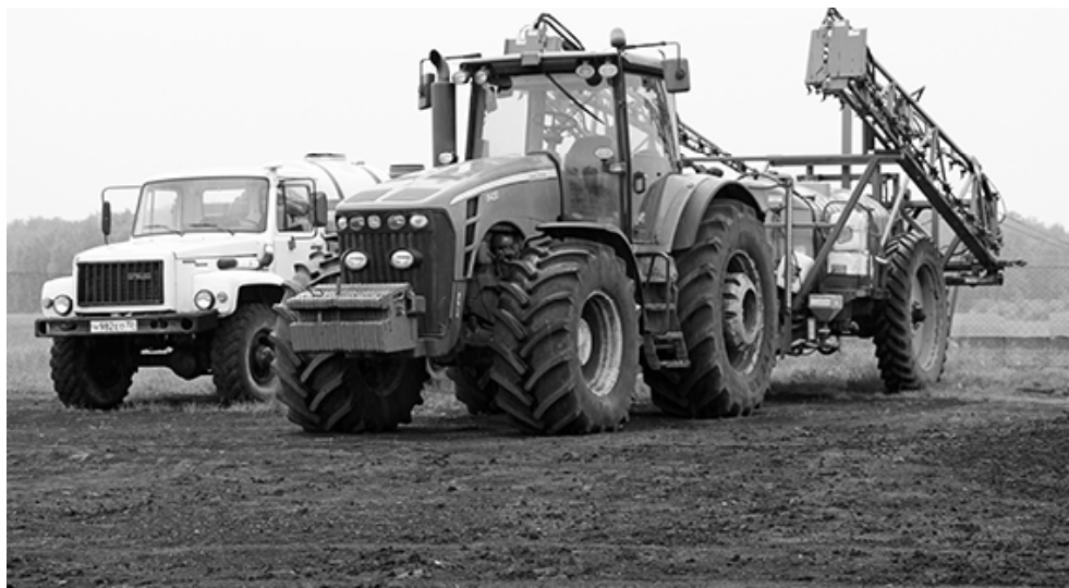
* Готовы выйти в поле