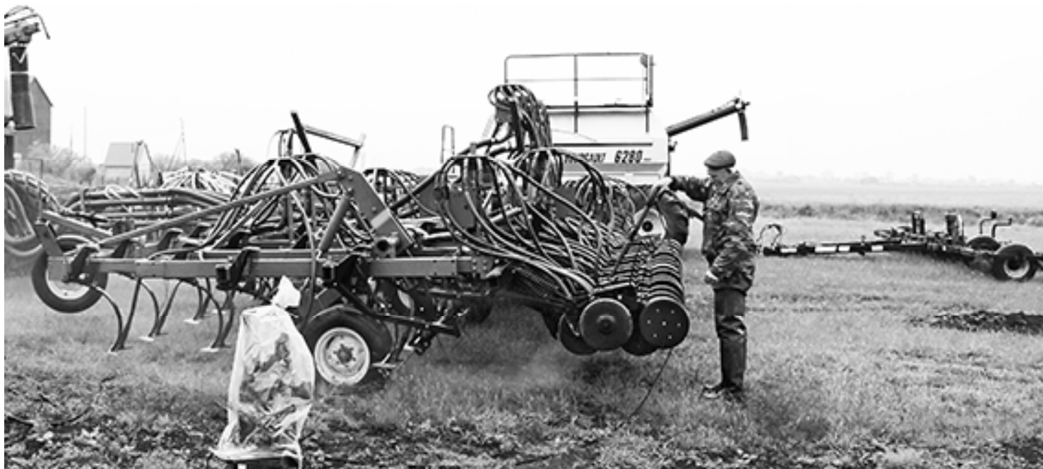
* Посевной комплекс отправляется на стоянку

Посевная позади. Механизаторы Сладковского участка ОАО «Агротехцентр» приняли все меры, чтобы заложить в почву добротные семена в оптимальные агротехнические сроки. Общая площадь засеянных площадей составила 4420 гектаров. На протяжении последних лет, сокращая «хлебное направление», предприятие активно внедряет в посевной оборот многолетние травы. Возделывать их на семена в нашей почвенно-климатической зоне экономически выгодно. Большая роль отводится в растениеводстве и рапсу. Если в какой-то год не будет хорошей цены на зерновые, выручат рыночно востребованные культуры.