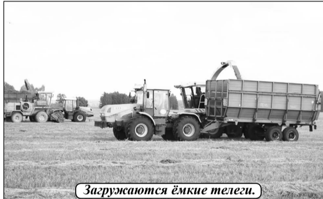
Загружаются ёмкие телеги.