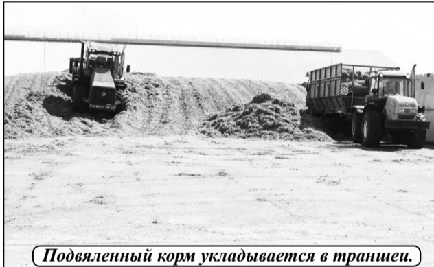
Подвяленный корм укладывается в траншею.