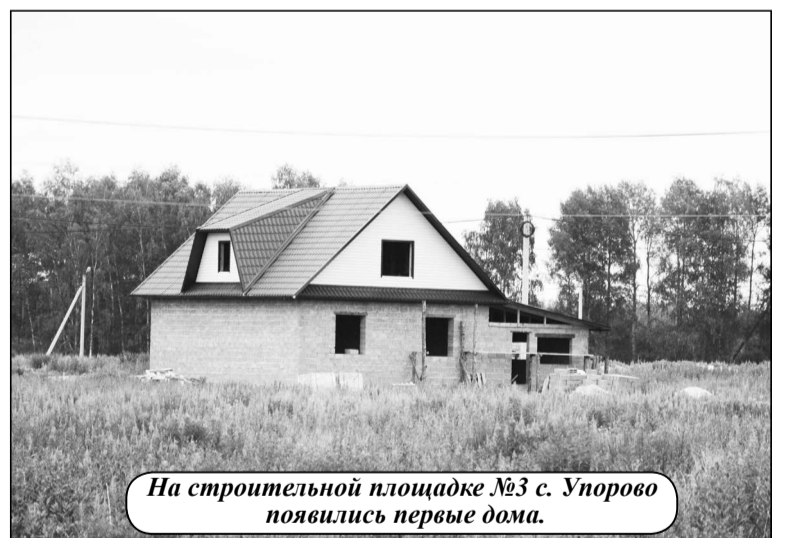
На строительной площадке №3 с. Упорово появились первые дома.

Что касается ремонта улично-дорожной сети, то на эти цели в этом году запланировано около 34,5 млн. рублей. Назову населённые пункты, в которых будут проводиться дорожные работы. В Упорово по улицам Зелёной, Строителей, Заводской. В Буньково – по ул. 50 лет Октября и к полигону твёрдых бытовых отходов. В Масальях – по ул. Школьной, а в Видоново установят автопавильон на с. площадке. Такой павильон появится и в Тютриной. В посёлке Емуртлинском будет отремонтирована дорога по ул. Садовой.