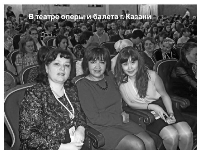
В театре оперы и балета г. Казани

Итоги участия в столь представительном интеллектуальном соперничестве для тюменской делегации оказались весьма успешными: работа ученицы 11 класса Андреевской