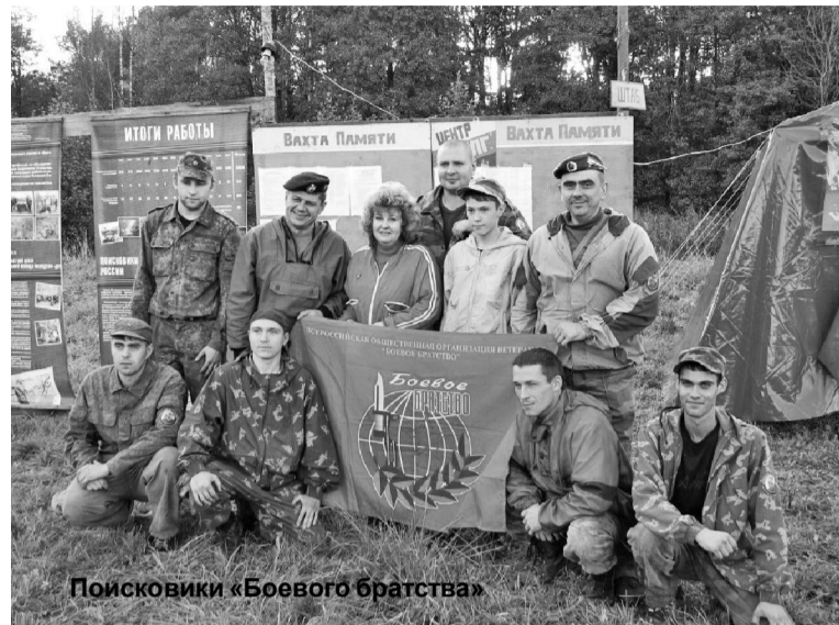
Поисковики «Боевого братства»