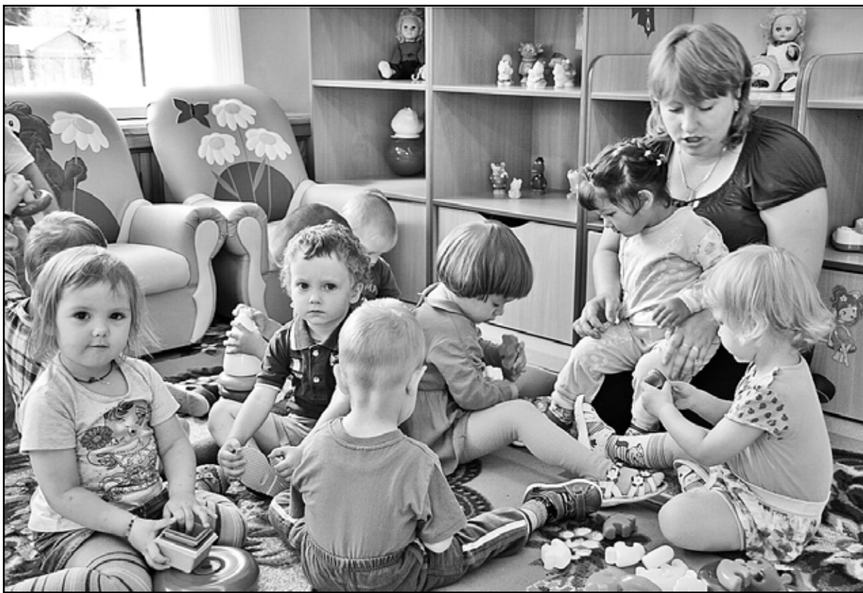
Дети с радостью идут в детсад