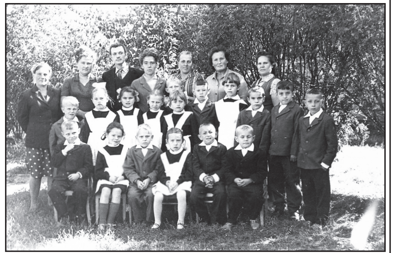
С выпускниками детского сада, 1968 г.