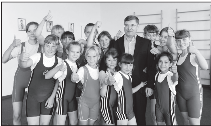
В.В. Якушев в ходе рабочей поездки в Гольшмановский район