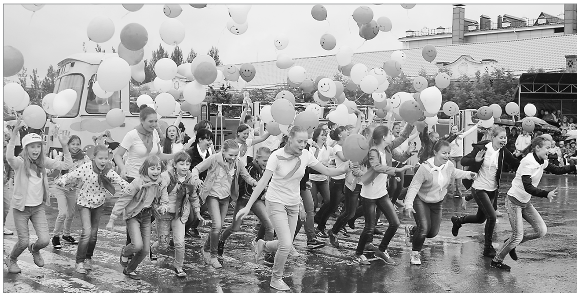
Радость без границ

Зрители приняли выступления «на ура». Но больше всего удивили юные помощники, только начинающие заниматься тяжёлой атлетикой. Они с лёгкостью возвращали к старту предметы, с которыми не смогли справиться богатыри. Правда, делали это вдвоём.