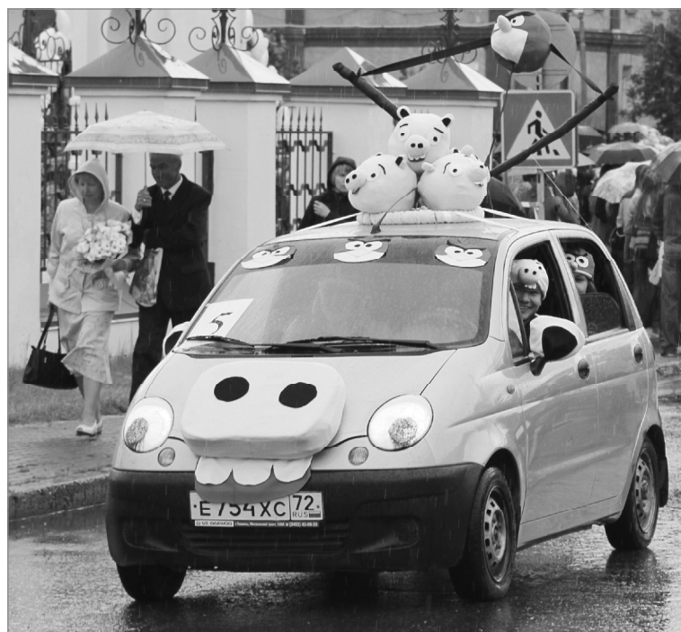
Фантазии автомобилистам не занимать