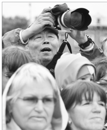
В погоне за кадром

Как только отзвучал вальс, Сретенскую площадь заполнили юные спортсмены - боксеры, футболисты, легкоатлеты, подчеркнув еще раз, что ялуторовчане выступают за здоровый образ жизни.