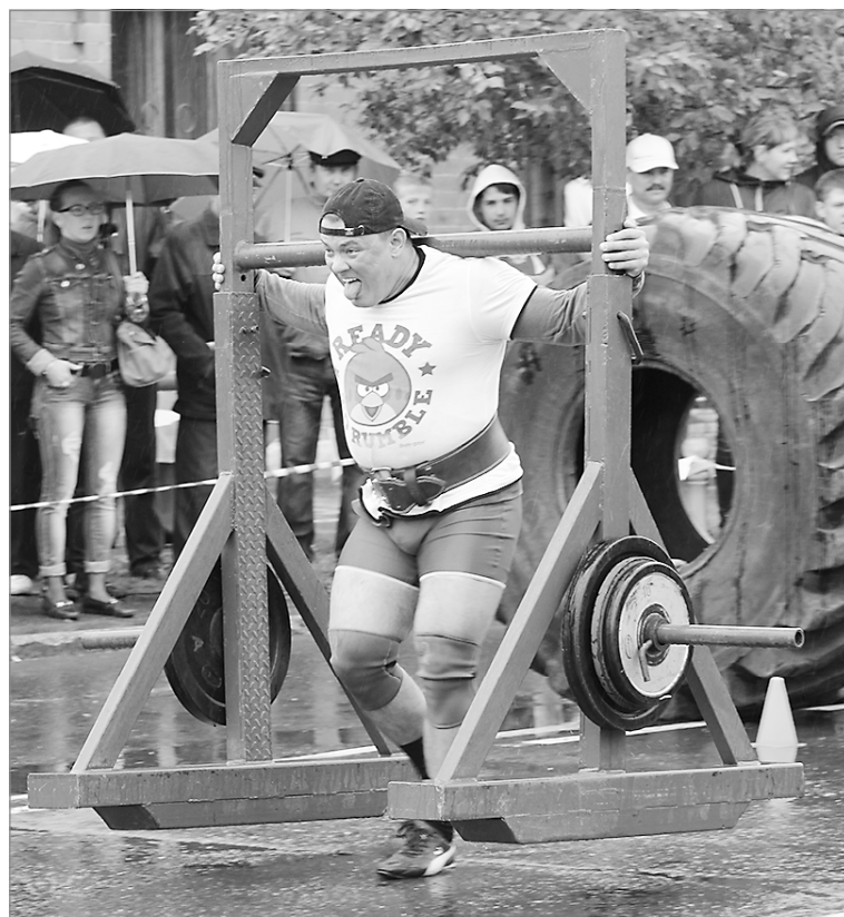
200 кг - это не шутки

Показать свою удалую силу и выносливость вызвались шесть