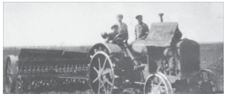
На полевых работах

Почти все мужчины в то время были на фронте, а ребята и женщины не могли во всём их заменить, приходилось чем-то жертвовать. Так, деревенский детский сад в войну работал лишь первый год, потом его закрыли - попросту некому было следить за малышнёй.