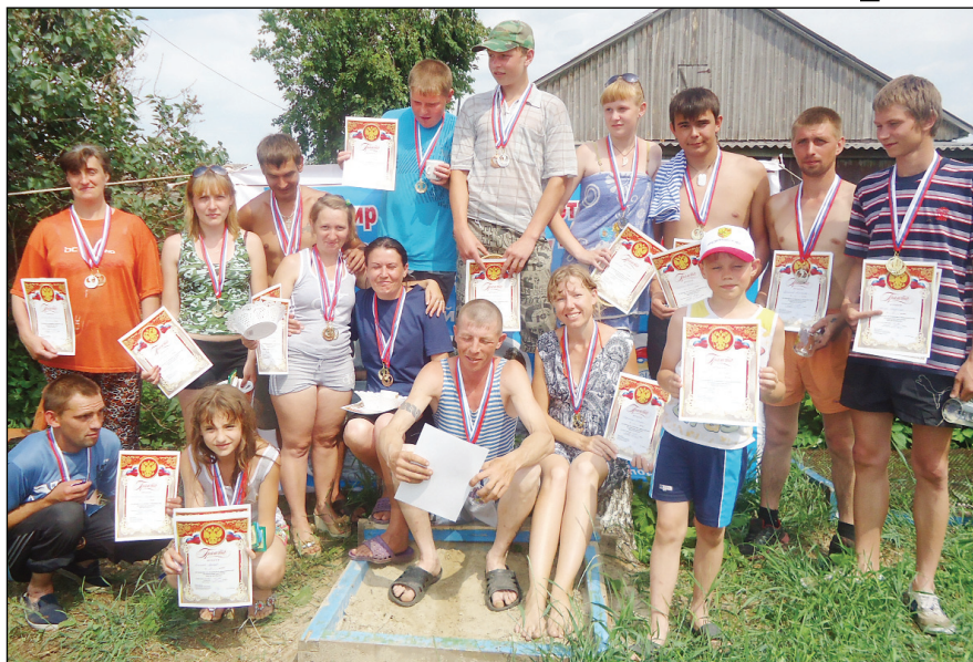
◆ Общее фото на память.