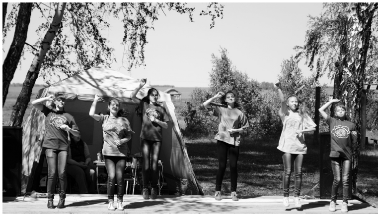
Нам все по плечу