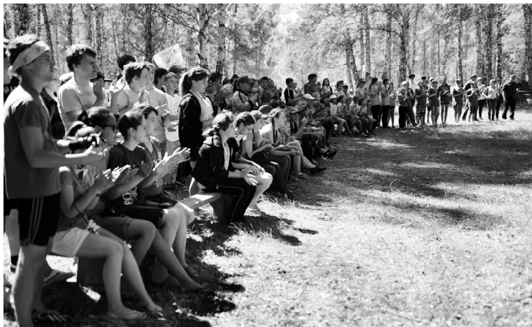
Участники слета во время церемонии открытия