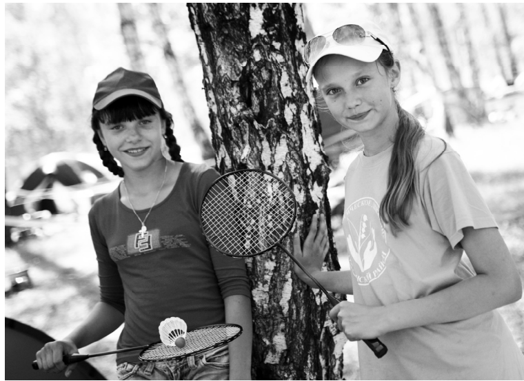
На слете и в бадминтон поиграть можно

Нынешний межрайонный слет экологических звеньев общеобразовательных учреждений был юбилейным - пятнадцатым. Проходил он в полюбившейся не одному поколению знатоков природы рощице близ села Шабаново.