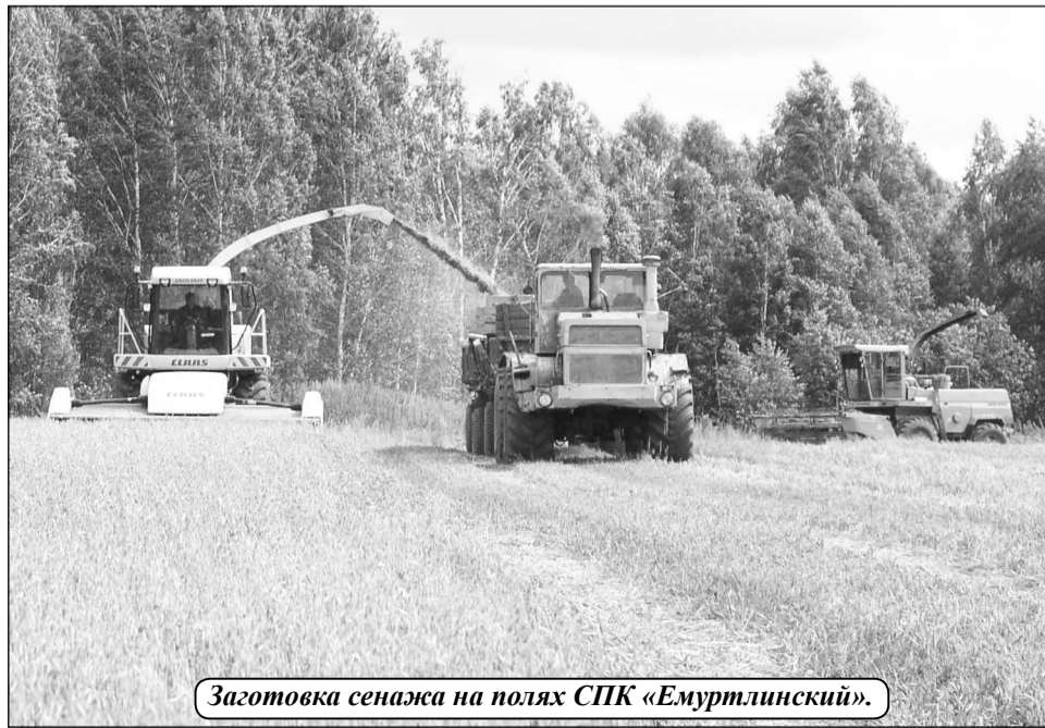
Заготовка сенажа на полях СПК «Емуртлинский».