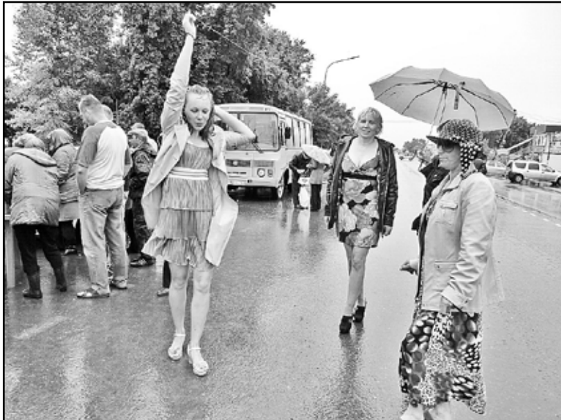
Танец под дождём – это прикольно

Практически на каждой районной сельскохозяйственной ярмарке появляется что-то новое. В этот раз, например, предлагали свою продукцию – свежеспечённые пироги с рыбой, капустой – умельцы