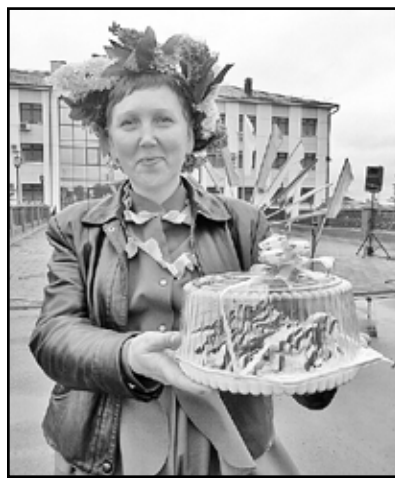
Победитель конкурса «Знай наших»

Новинка нынешней ярмарки – проведение конкурса «Знай наших». Здесь нужно было показать свои знания особенностей предприятий – производителей продукции района. Предоставили свои призы, а соответственно и были подготовлены вопросы о деятельности агрофирмы «Новоселезнё-