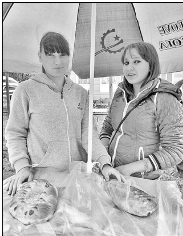
Горячие пироги от пекарни «Вкусные традиции»