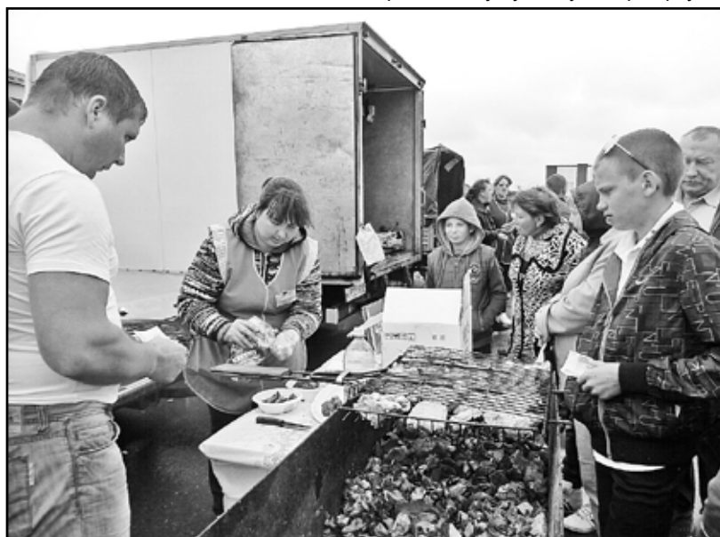
Вкусный шашлычок у «зареченцев»