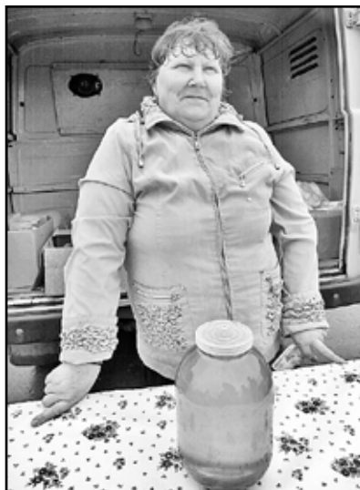
Осталась последняя банка мёда

во» (приз – колбаса «Краковская»), ООО «Маяк-Продукт» (полуфабрикаты), ООО «КООПХЛЕБ» (торты и хлебобулочные изделия), ЗАО «Казанская рыба» (копчёная пелядь). Кстати сказать, подобные конкурсы организаторы ярмарки намерены проводить и в дальнейшем.