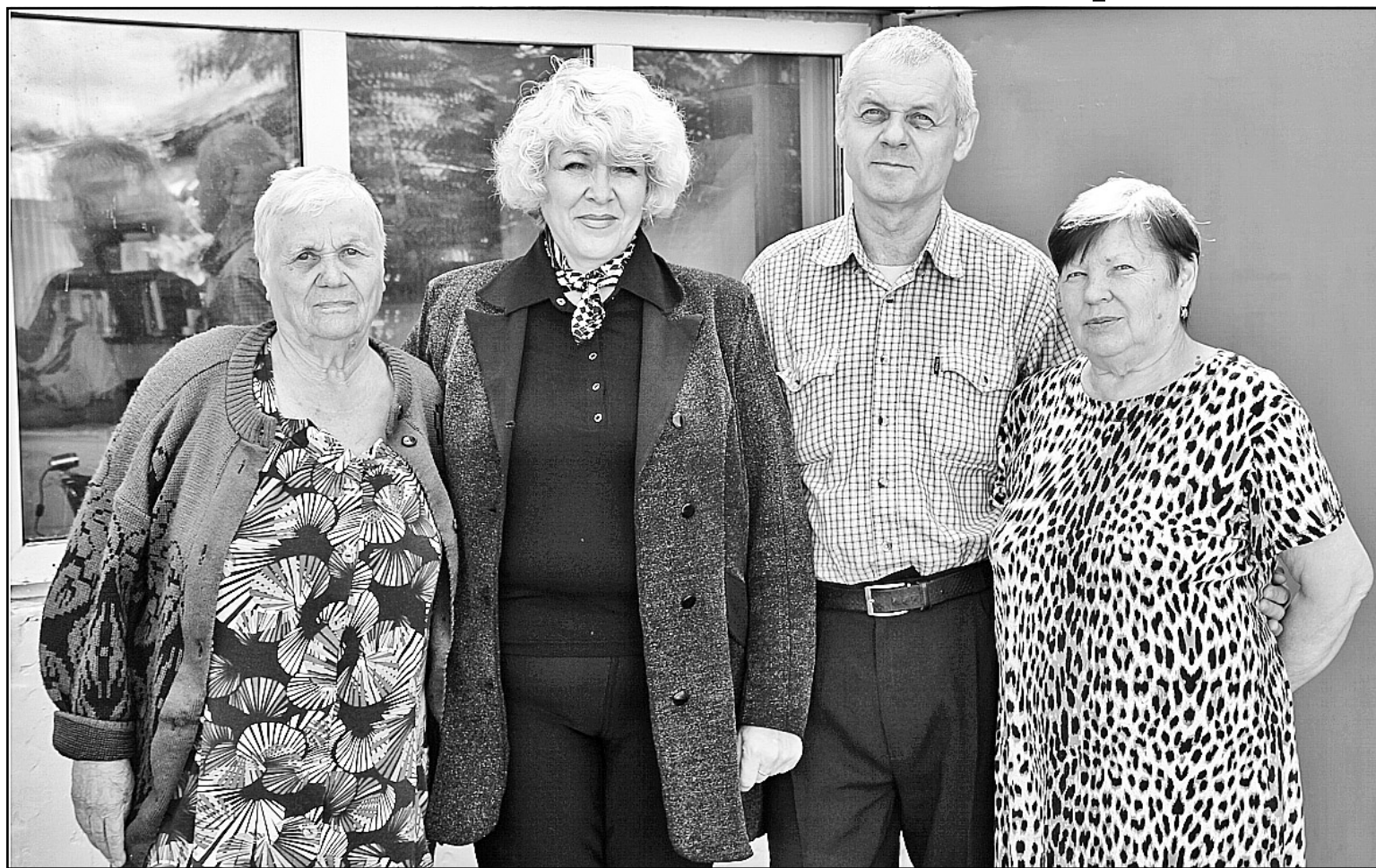
Данилевские и Александра – дальние родственники, в беде оказавшиеся ближе ближнего