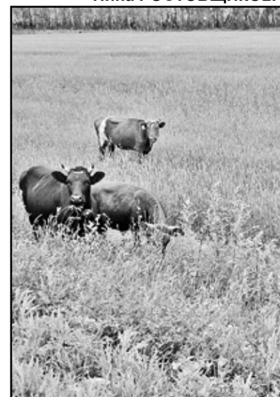
Губит посевы бродячий скот