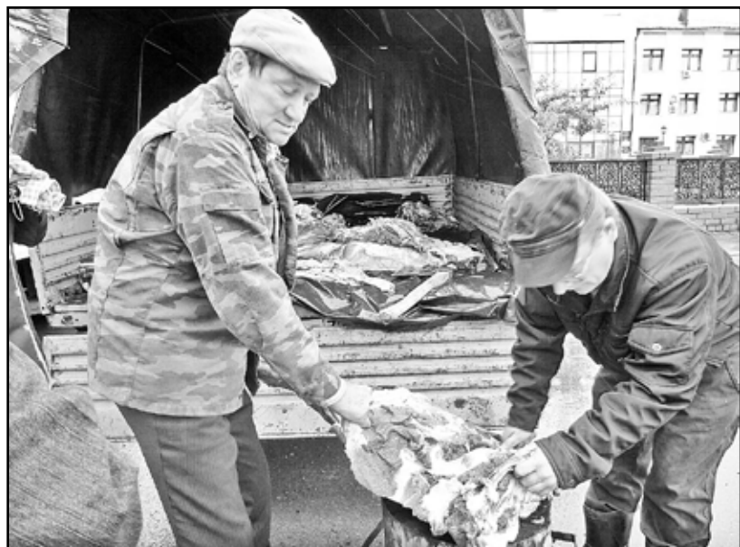
Мясо на ярмарках всегда идёт нарасхват