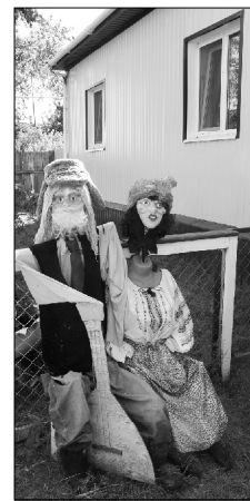
Не стоит забывать о доброте, - сказала мне на прощание хозяйка дома.

Материалы подготовила Ольга РОДИОНОВА.