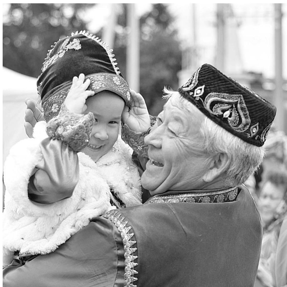
Празднику рады все.