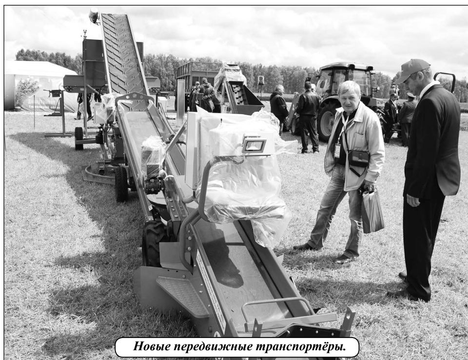
Новые передвижные транспортёры.

Ровные и чистые цветущие картофельные плантации приятно удивили зарубежных гостей. Нашим специалистам было задано немало вопросов о том, как и когда высаживался картофель, какие сорта, какими сажалками, какие удобрения и средства защиты растений применялись, что делалось для