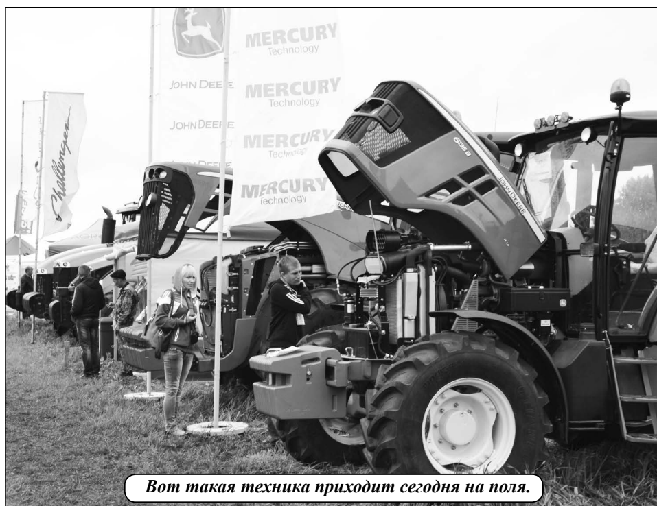
Вот такая техника приходит сегодня на поля.