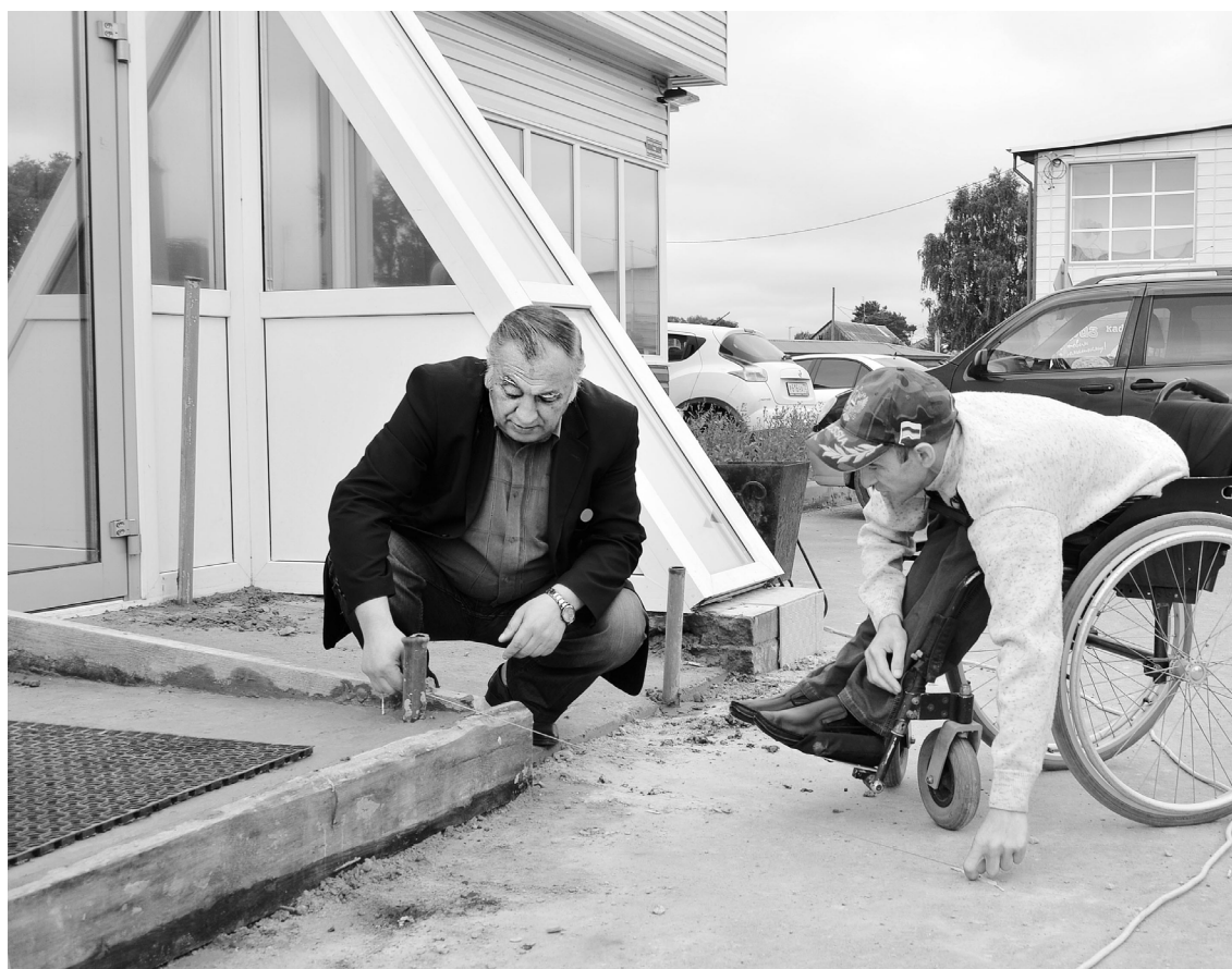
Не всё так просто, когда дело касается соблюдения определённых параметров к пандусу.

В иное время прошёл бы мимо и не обратил внимание на копошащихся и что-то измеряющих людей у входа в торговый центр «Заречье», но знакомые лица заставили остановиться. Поздоровавшись, я прислушался к разговору. Оказывается, руководители торгового центра при устройстве пандуса решили не заикливаться на расчёт-