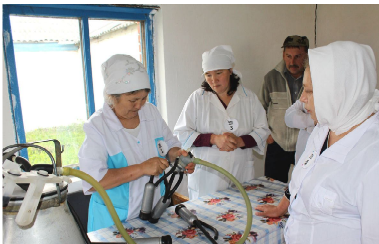
Идет сборка доильного аппарата