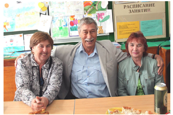
Сибирское гостеприимство растопило сердце сдержанного немца